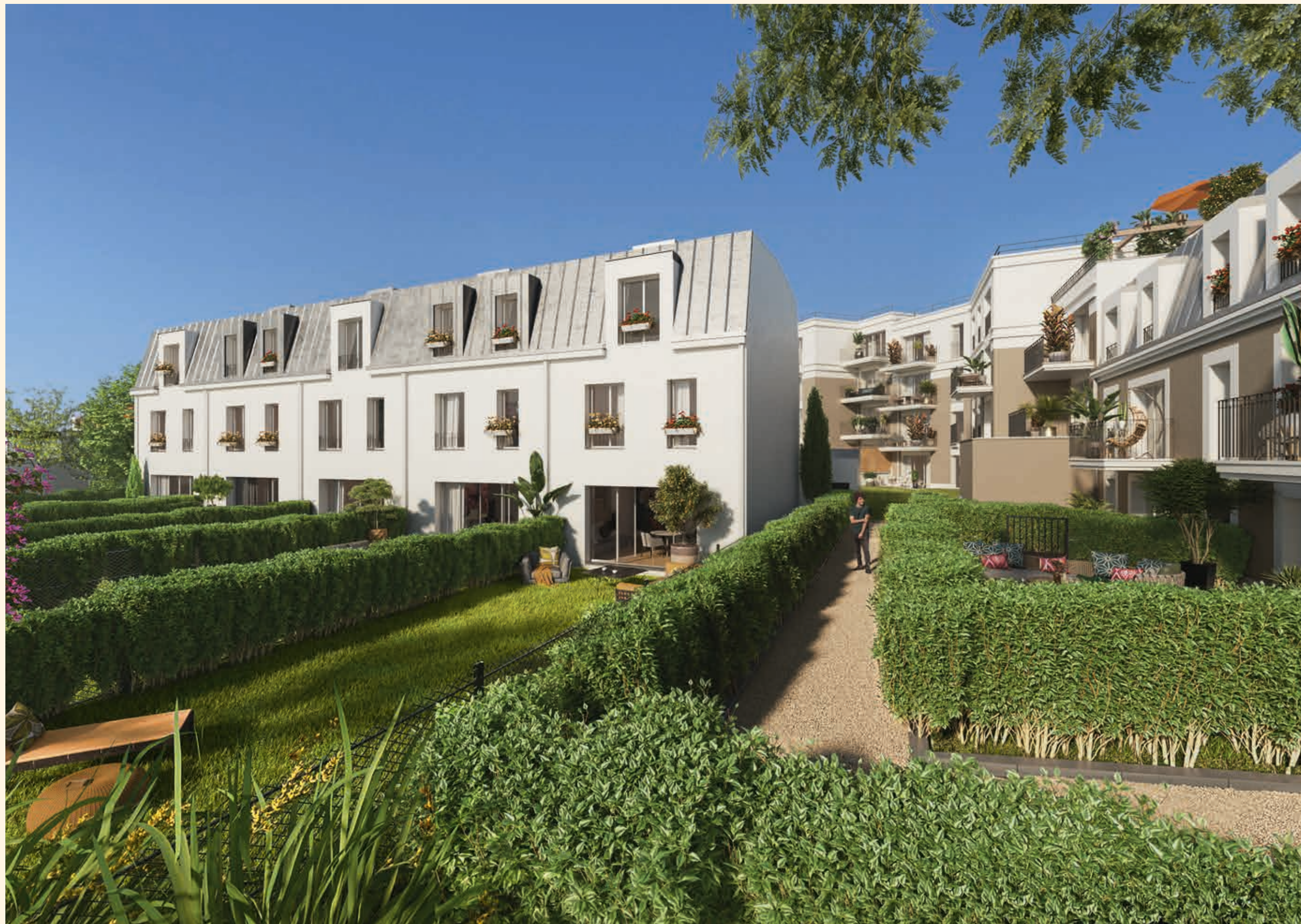
Vue depuis le cœur d'îlot