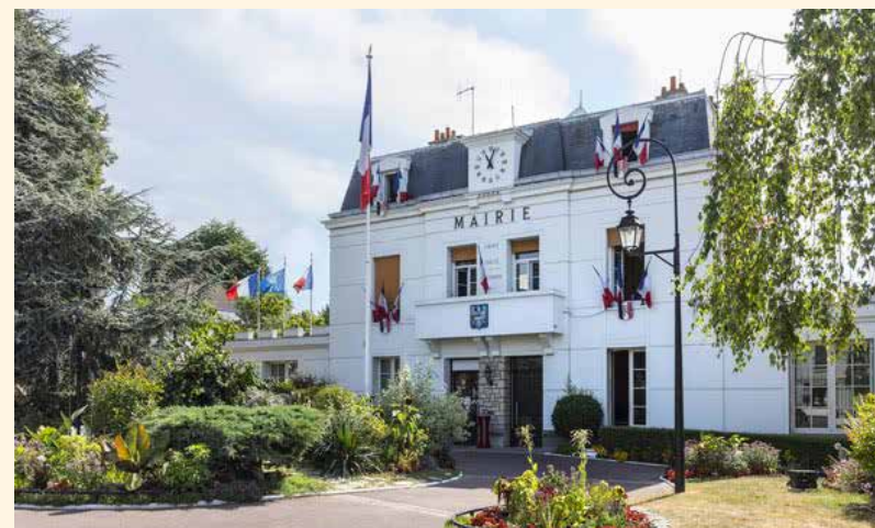
Mairie de Neuilly-Plaisance

Paris et les grands pôles d'emplois comme Marne-la-Vallée sont accessibles rapidement par les autoroutes A86, A3 et A4 ou par le RER A qui rejoint la station "Châtelet" en 15 minutes*. Bientôt la gare "Val de Fontenay" (RER E et A) accueillera la ligne 15 du Grand Paris Express et le terminus de la ligne 1 du métro. Des lignes de bus et des pistes cyclables permettent de sillonner la ville et les communes voisines.