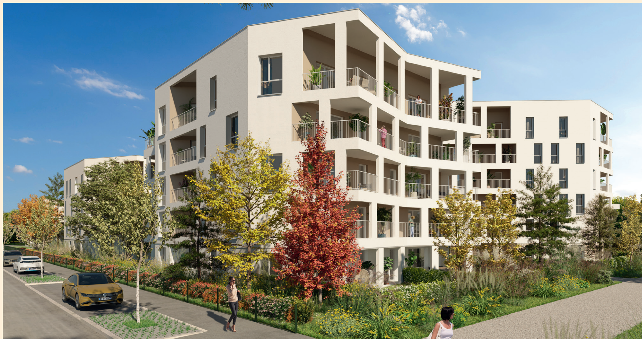
Vue depuis le boulevard du Colonel Marey