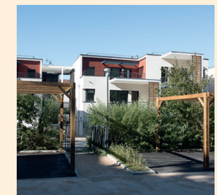
Logements collectifs « Résidence Desjoyaux », rue et impasse Desjoyaux