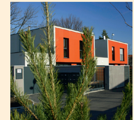
Ensemble de maisons « Les jardins Sambat », rue Sambat

3 e RÉALISATION DE SPIRIT À SAINT-ÉTIENNE