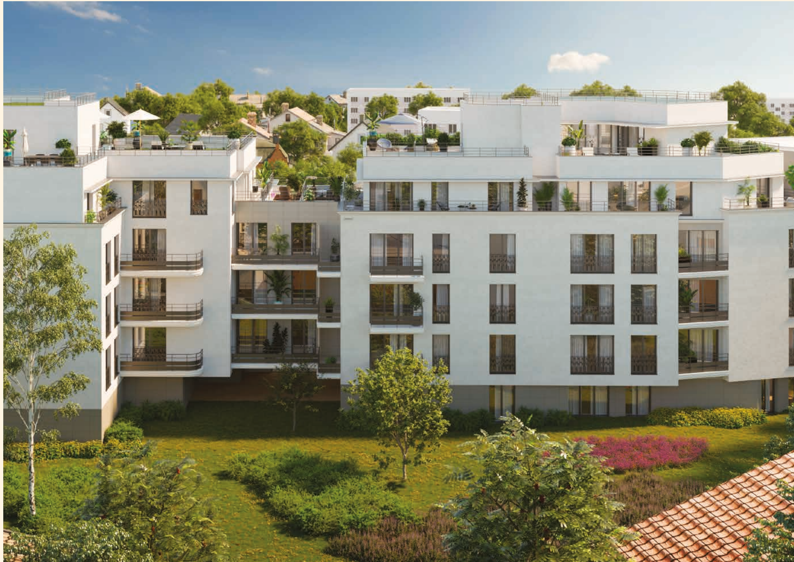
Vue depuis le cœur d'îlot