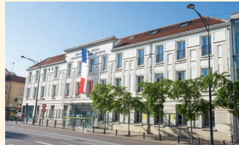
Mairie de Champigny-sur-Marne

À proximité des grands pôles d'activité, Champigny-sur-Marne démontre par son dynamisme et sa modernité qu'elle a su mettre en valeur ses nombreux atouts. Facilement accessible par les transports en commun et les grands axes routiers, la ville offre un quotidien en tout point pratique.