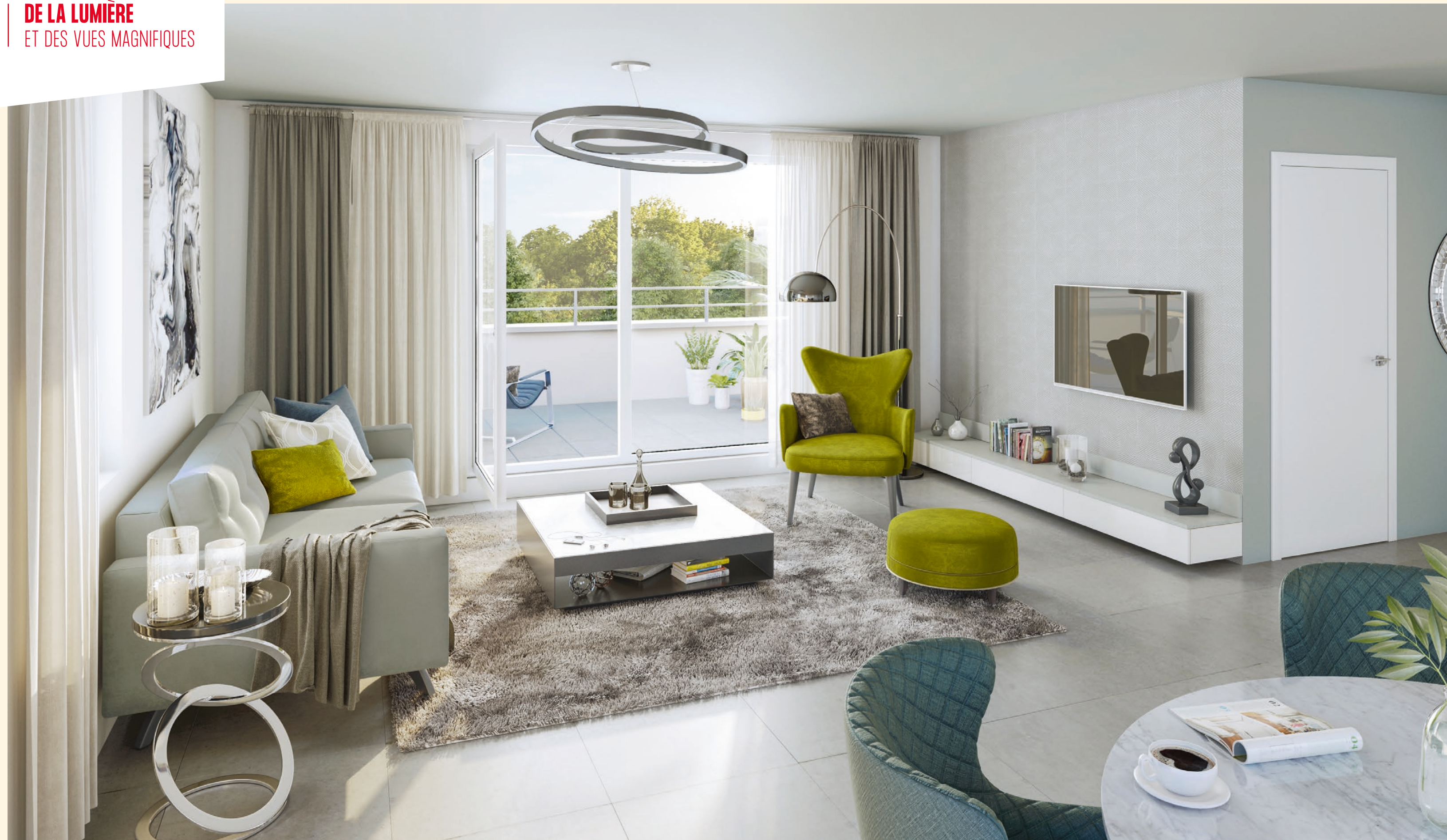
Vue depuis un appartement de la résidence "Elegancia"

La conception de la résidence, la diversité de ses volumes et de ses ouvertures favorisent la grande luminosité des intérieurs. Dans ces intérieurs inondés de lumière, du 2 au 5 pièces, l'atmosphère de bien-être paisible se trouve renforcée par les belles dimensions des espaces et leurs finitions soignées.