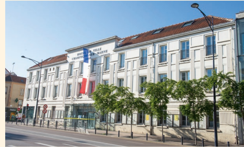
Mairie de Champigny-sur-Marne

À proximité des grands pôles d'activité, Champigny-sur-Marne démontre par son dynamisme et sa modernité qu'elle a su mettre en valeur ses nombreux atouts. Facilement accessible par les transports en commun et les grands axes routiers, la ville offre un quotidien en tout point pratique.