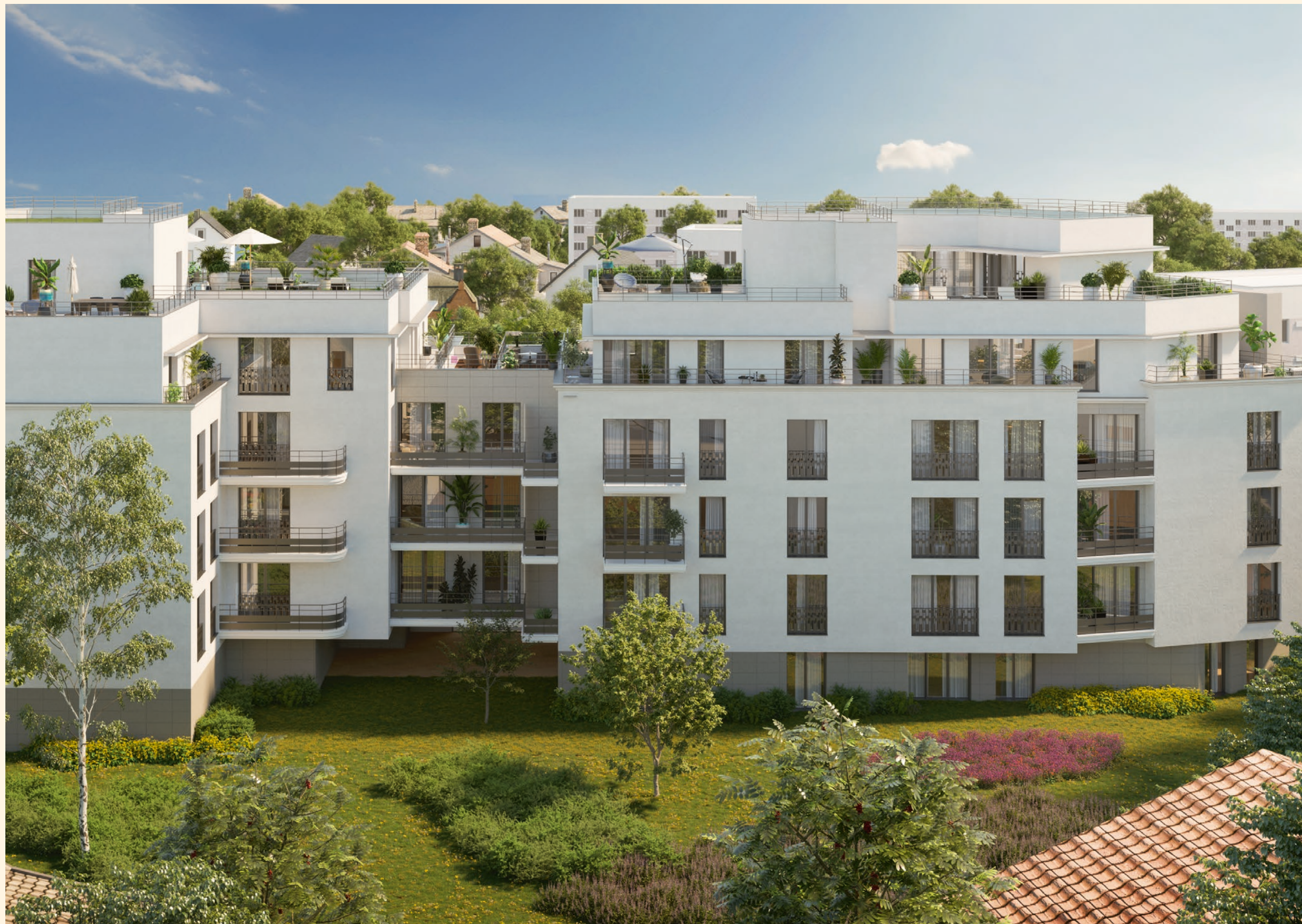
Vue depuis le cœur d'îlot