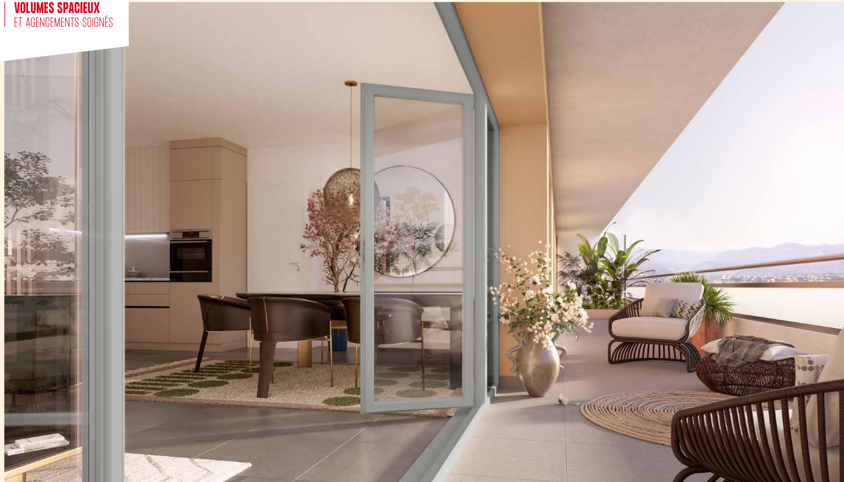
Vue depuis un appartement de la résidence "Genève Parc"

Au cœur de la ville, la résidence "Genève Parc" accueille des appartements du 2 au 5 pièces qui répondent chacun, avec justesse, aux nouveaux modes d'habiter. Agencés de manière contemporaine autour d'une grande cuisine ouverte, ils reposent sur des plans savamment orchestrés de manière à délimiter strictement les pièces de jour et de nuit... Avec à la clé une meilleure qualité de vie au quotidien !