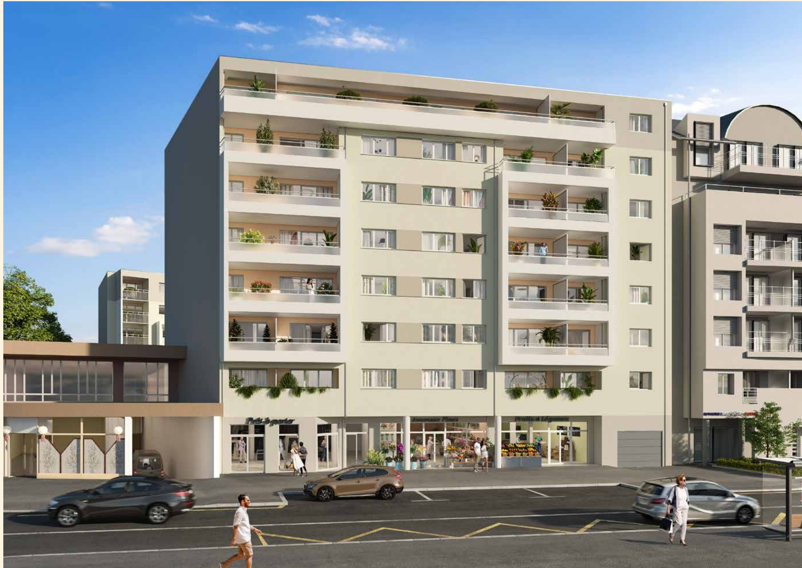
Vue depuis la rue de Genève