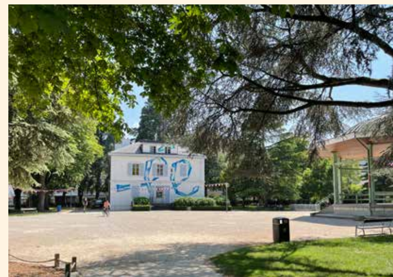
Le Parc de Montessuit