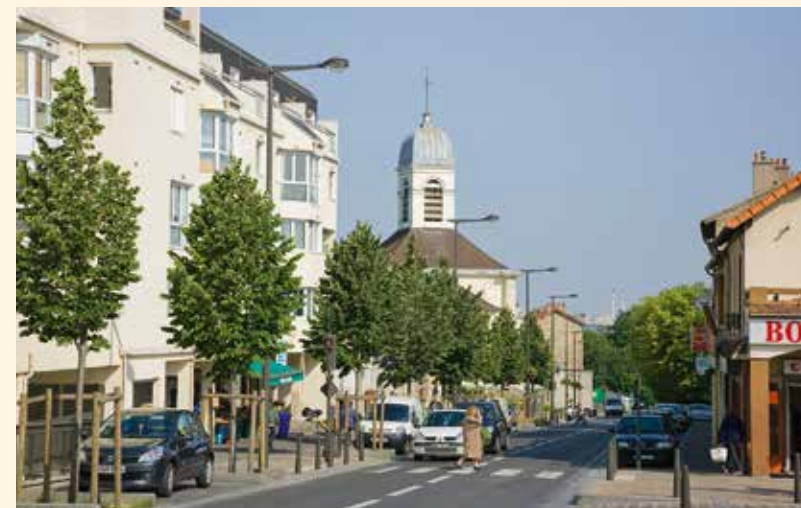
Rue du Colonel Fabien

Siège d'anciennes seigneuries, la ville a su préserver ses atouts au fil des siècles, dont ses 84 hectares d'espaces naturels. Ses parcs départementaux de la Plage Bleue et du Champ-Saint-Julien, ou encore ses parcs de La Libération et Jacques Duclos, héritages des anciens domaines qu'elle accueillait autrefois, contribuent sans conteste à son statut de ville verte.