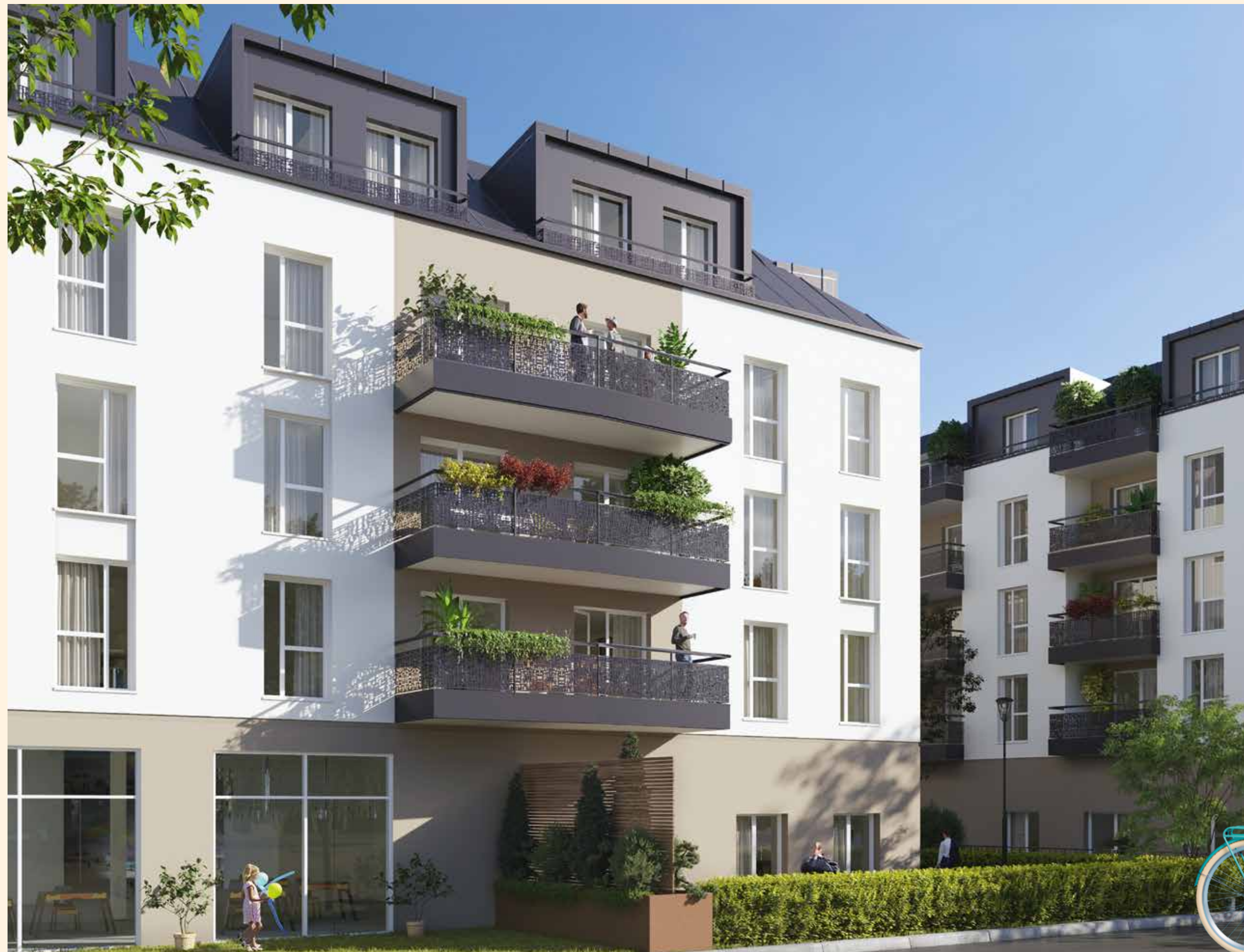
Vue depuis les jardins