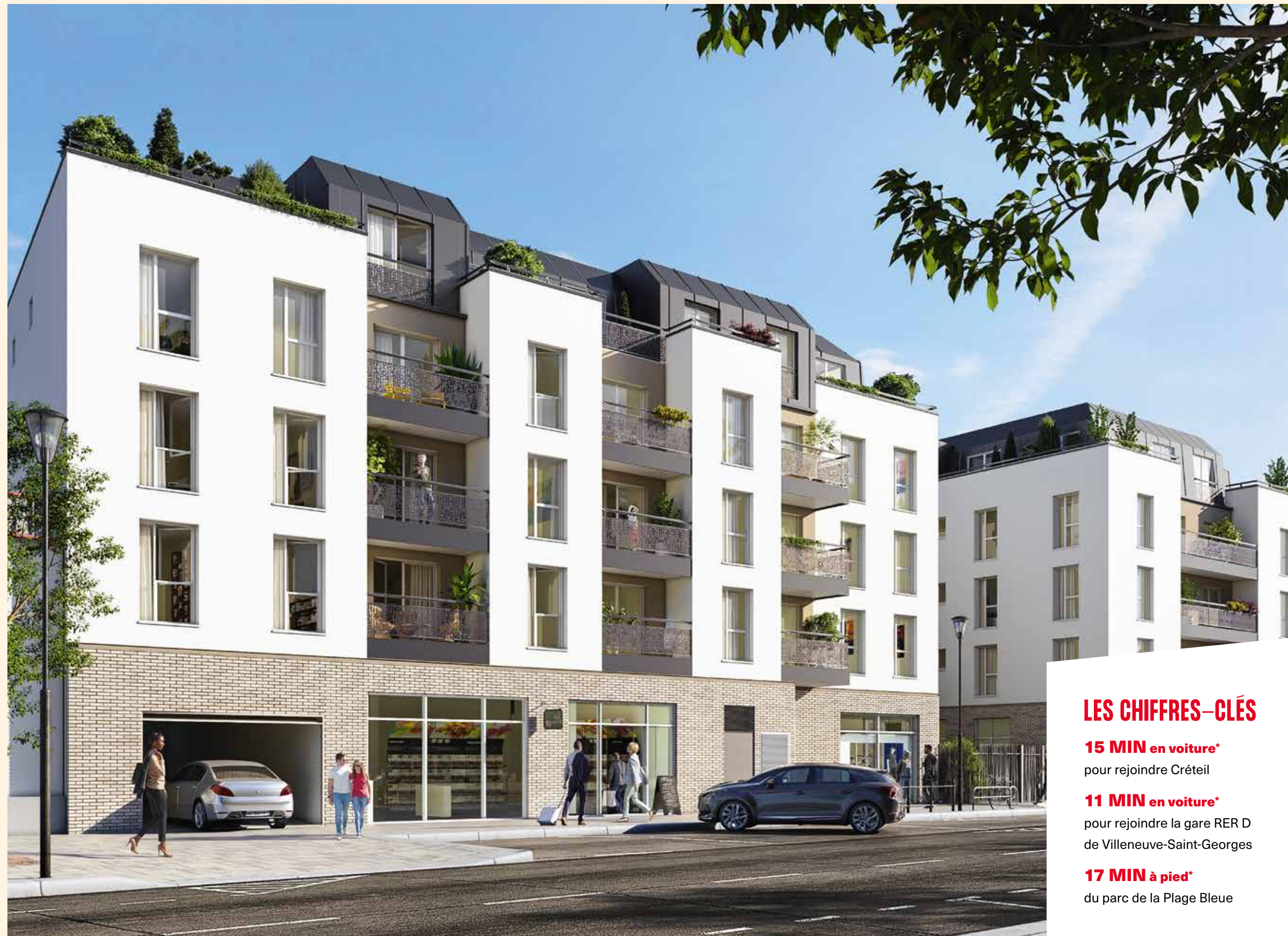
Vue depuis la rue Gabriel Péri

Tournés vers le cœur d'îlot paysager pour quelques-uns, ils permettent en outre de profiter de vues agréables et reposantes, à proximité de toute l'animation du centre-ville. En pied d'immeuble, des commerces viennent animer la résidence et parfaire l'offre proposée à seulement quelques pas.