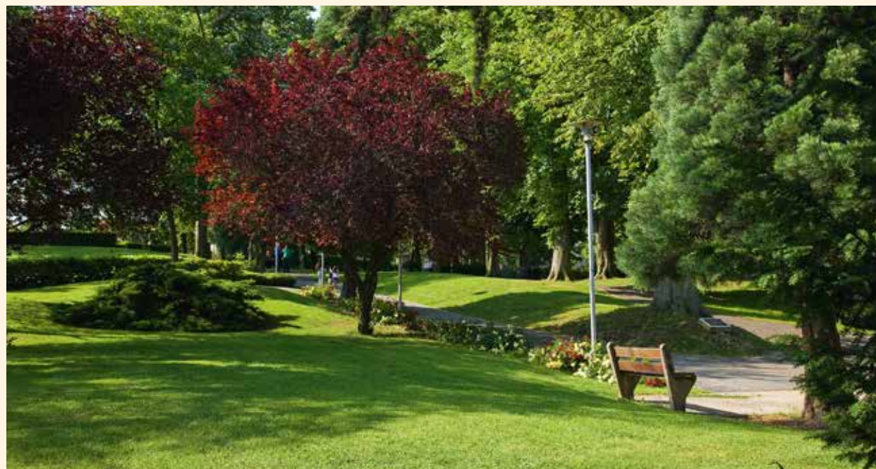
Parc de la Libération