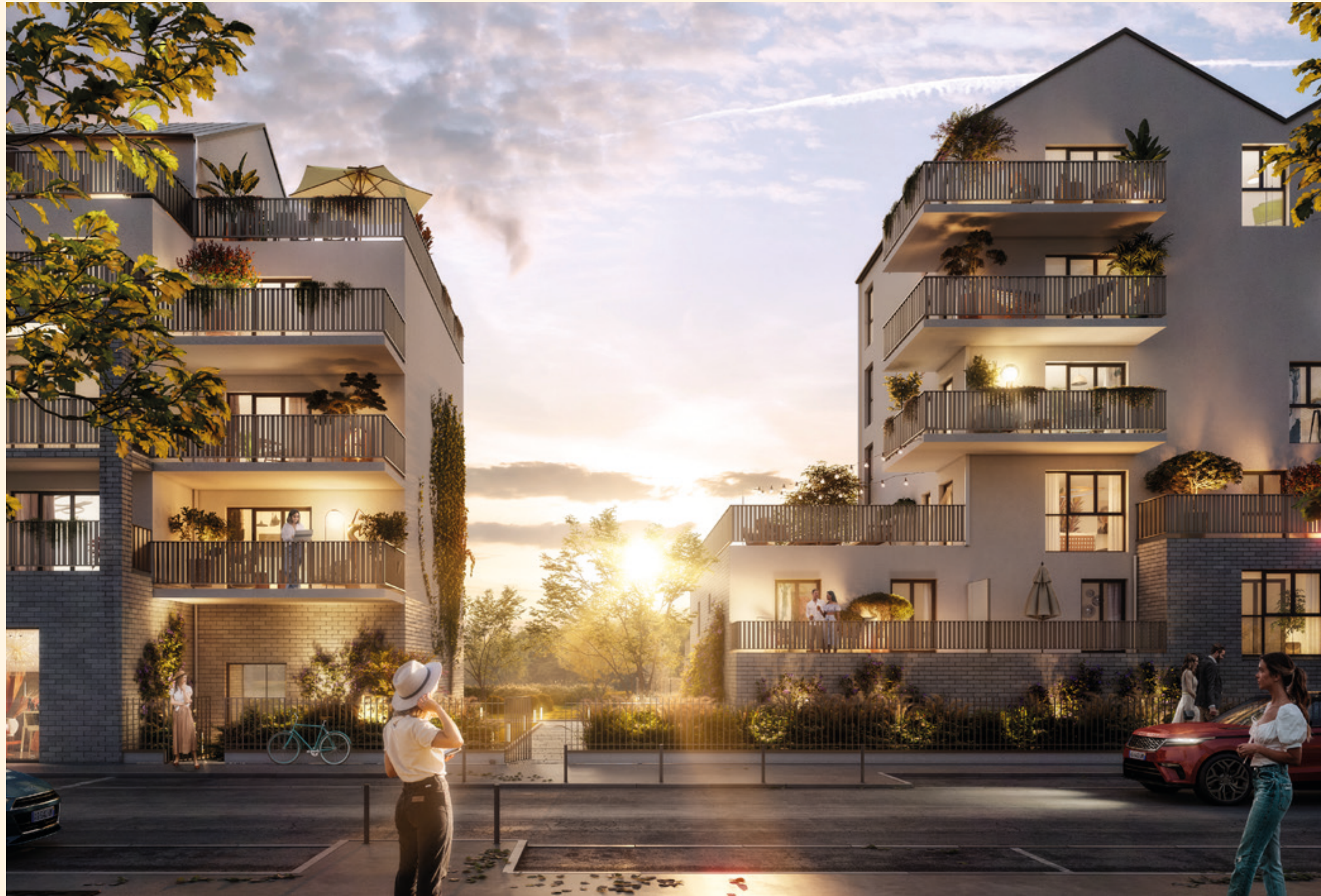
Vue depuis l'allée Jules Renard

Les toitures métalliques à deux pentes et les garde-corps finement ouvragés apportent un indéniable cachet à cette réalisation d'exception entièrement sécurisée.