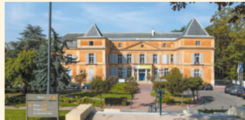
Mairie de Clichy-sous-Bois

Clichy-sous-Bois est également une ville dynamique proche de la capitale et des grands pôles économiques tels que Marne-la-Vallée et Roissy Charles-de-Gaulle. Sa bonne desserte routière (autoroutes A3 et A86) et son bon réseau de transports en commun avec le tramway T4 (qui permet de relier le RER B et le RER E en 20 minutes*) et l'arrivée prochaine de la ligne 16** du métro dans le cadre du Grand Paris Express permettent de concilier facilement vie professionnelle et vie personnelle. Au quotidien, les Clichois profitent d'un centre-ville convivial, de nombreux commerces, de cinq centres commerciaux, d'un marché de produits frais, de structures scolaires et d'une offre culturelle et sportive de qualité.