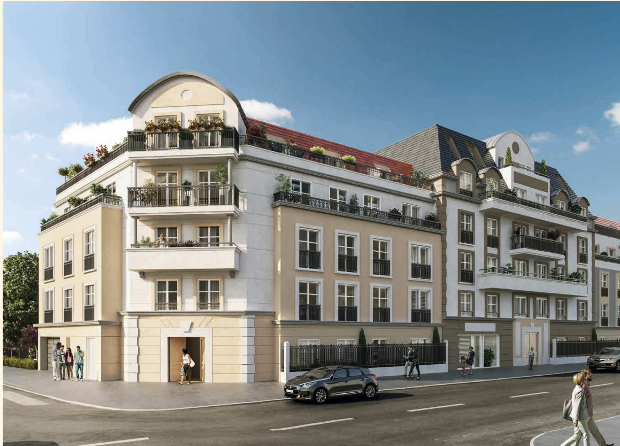
Vue depuis l'avenue Paul Vaillant-Couturier

Dans cette résidence entièrement sécurisée, tout a été imaginé pour offrir une qualité de vie conviviale et sereine. L'entrée rue de Londres, propose un jardin commun paysager. Des pelouses, des haies vives, des jardinières fleuries et des arbres choisis pour la qualité de leurs essences apportent une ambiance végétale douce et apaisante pour le seul plaisir des habitants.