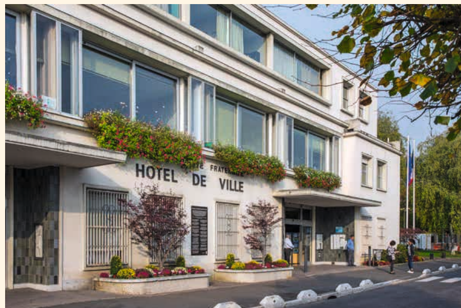
Mairie du Blanc-Mesnil

Cette vitalité s'épanouit dans un environnement naturel privilégié. Au cœur de la ville, un parc urbain de plus de 24 hectares fait le bonheur chaque jour des Blanc-Mesnilois.