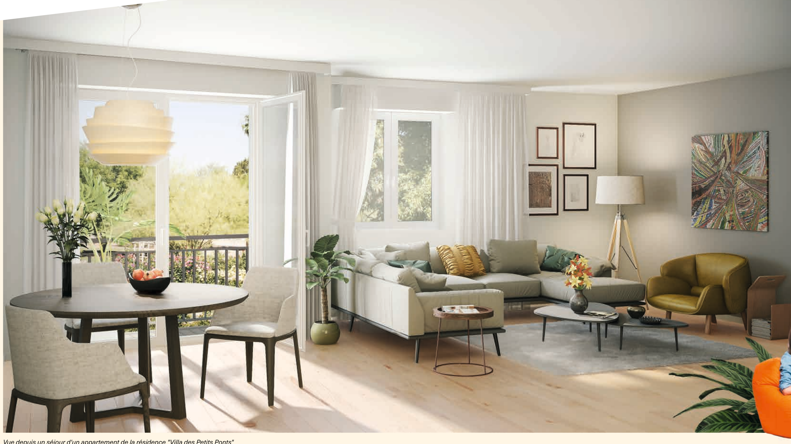
Vue depuis un séjour d'un appartement de la résidence "Villa des Petits Ponts"

Cette résidence élégante est composée de 83 appartements répartis sur 3 bâtiments. "Villa des Petits Ponts" a été imaginée pour apporter un maximum de confort et de luminosité. Les appartements du studio au 4 pièces bénéficient tous de plans minutieusement étudiés, de volumes optimisés et de finitions de qualité. Les grandes ouvertures laissent la lumière naturelle sculpter les intérieurs tout au long de la journée. Les séjours spacieux s'ouvrent pour la plupart sur des balcons, des terrasses et des jardins privatifs en rez-de-chaussée.