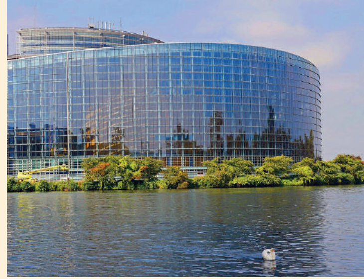
Strasbourg, Grand Est, France

Idéalement située au carrefour d'axes ferroviaires et routiers majeurs, elle jouit d'une position stratégique enviée, renforcée par sa connexion directe au Rhin, première voie fluviale de l'Hexagone.