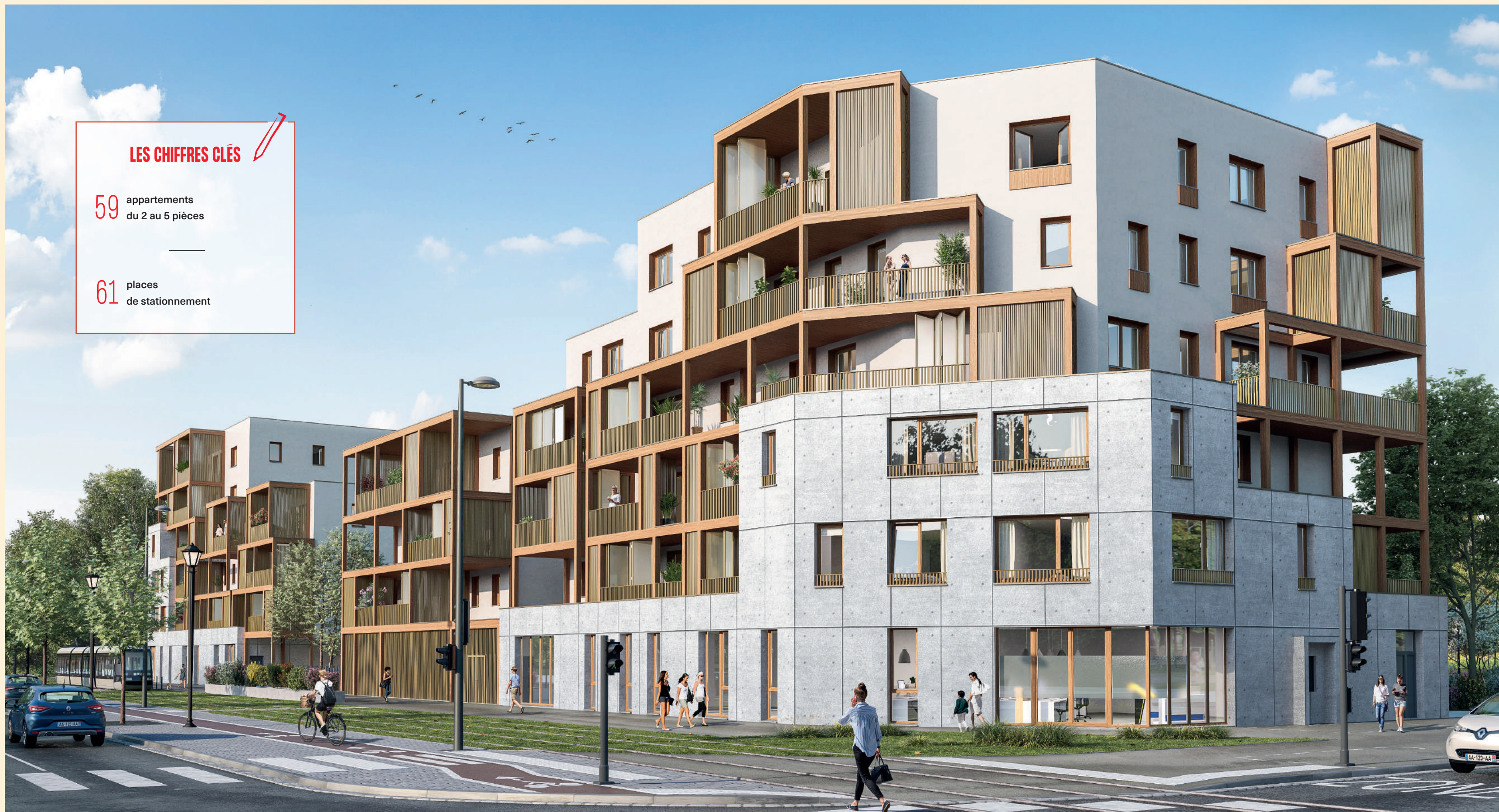
Avenue du Neuhoof