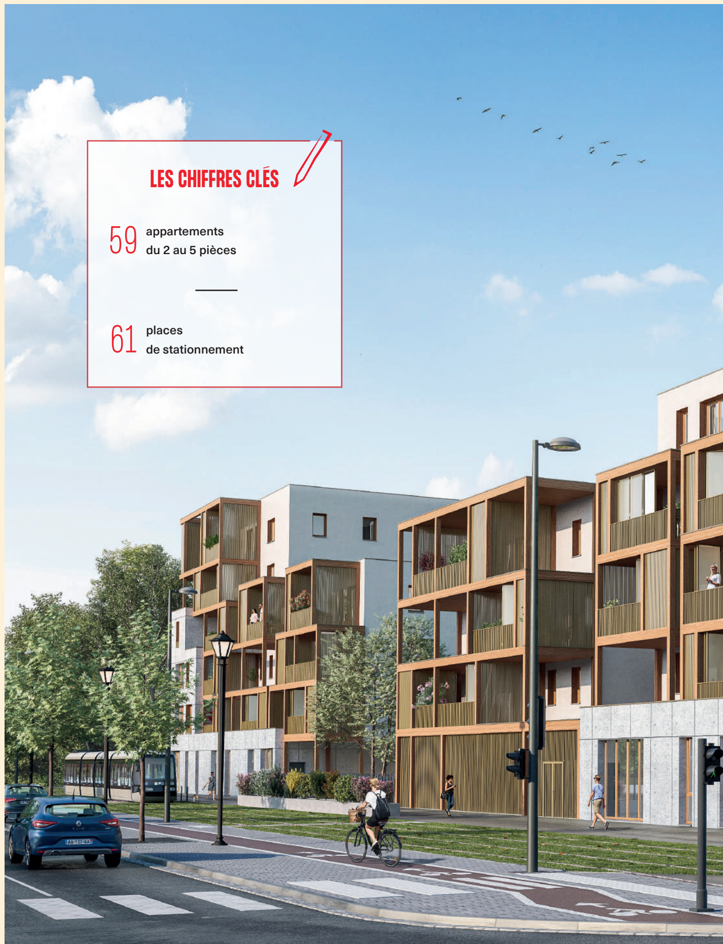
Avenue de Neuhof