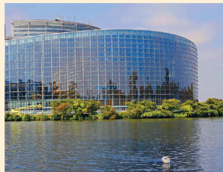
Strasbourg, Grand Est, France

Idéalement située au carrefour d'axes ferroviaires et routiers majeurs, elle jouit d'une position stratégique enviée, renforcée par sa connexion directe au Rhin, première voie fluviale de l'Hexagone.