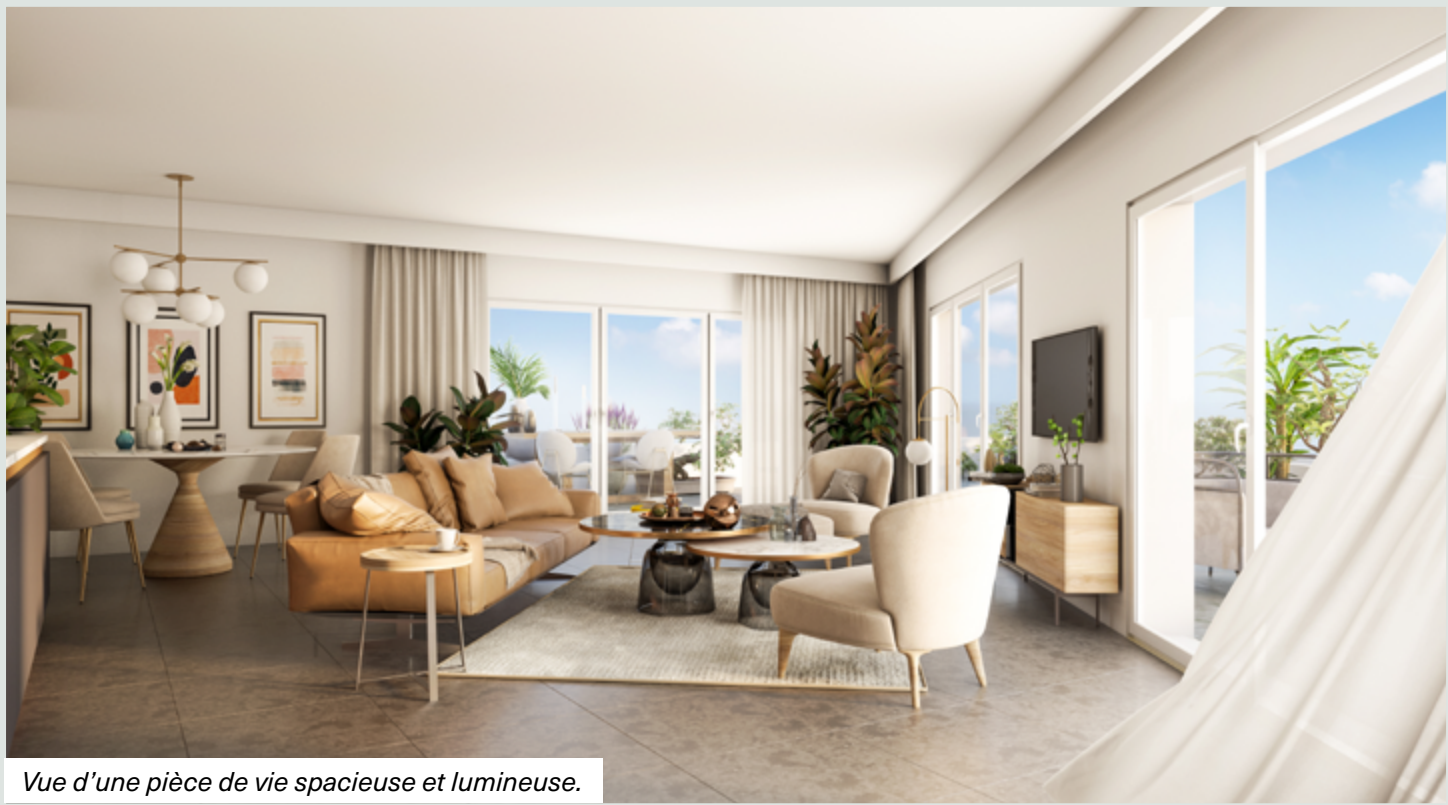
Vue d'une pièce de vie spacieuse et lumineuse.