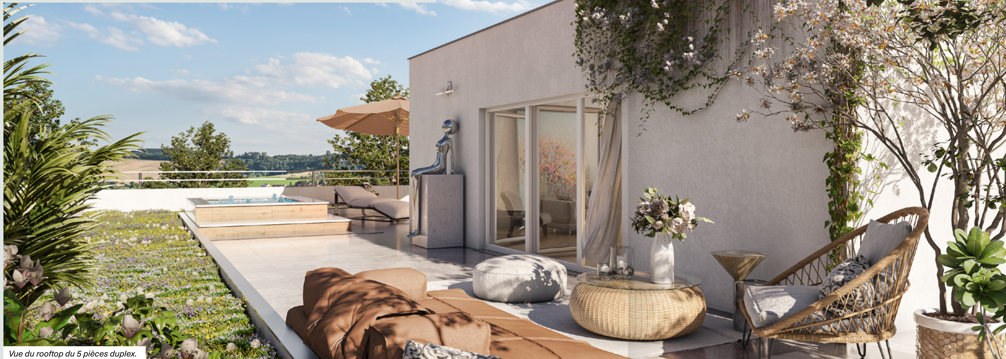
Vue du rooftop du 5 pièces duplex.