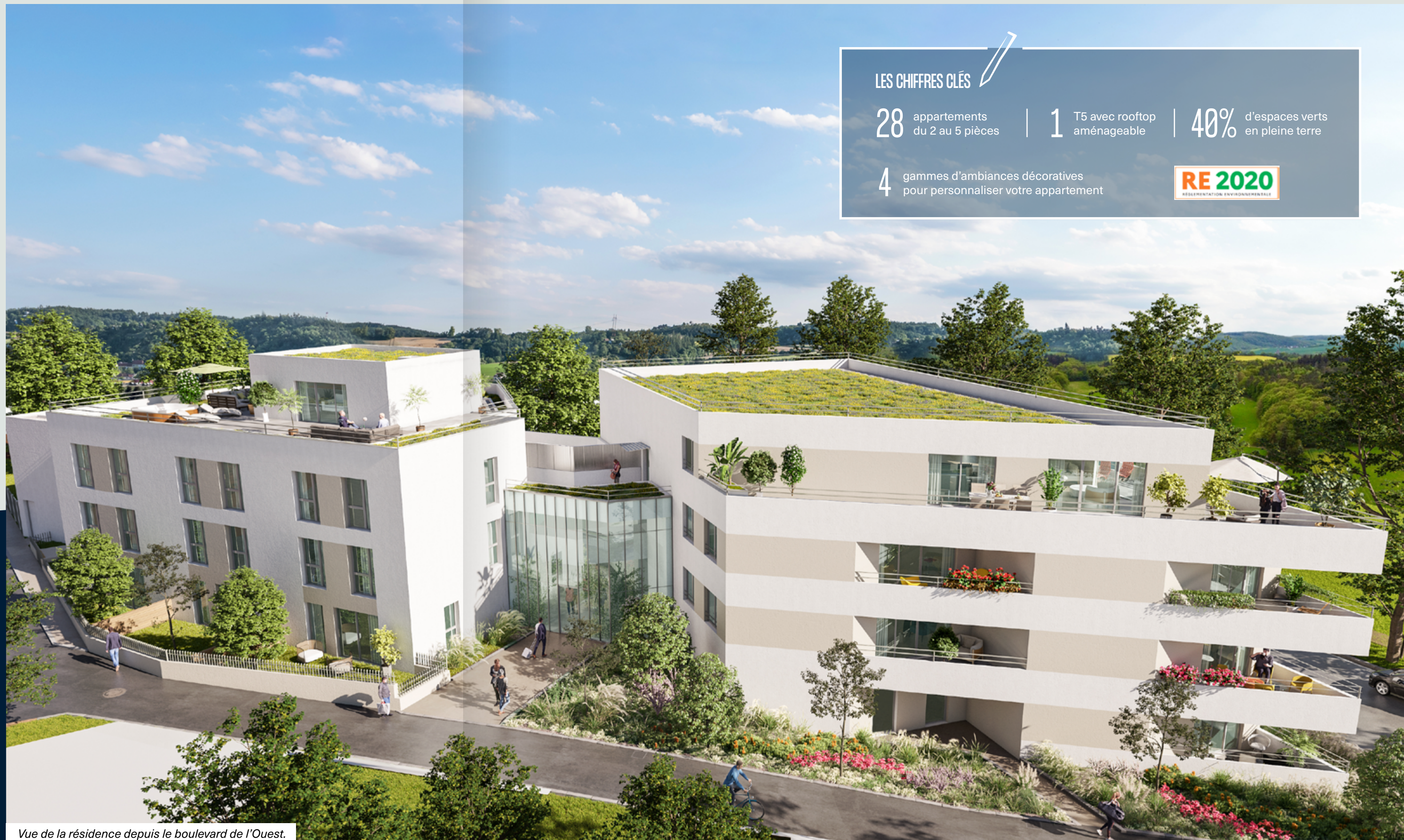
Vue de la résidence depuis le boulevard de l'Ouest.

Pierre-Yves CUSIN – l'Atelier 127 ARCHITECTES