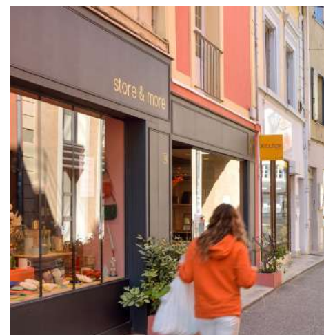
5. Place Xavier Ricard