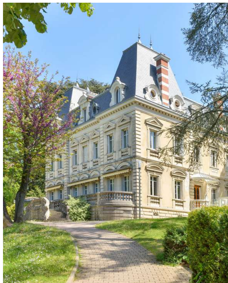
1. La Mairie et son parc

A seulement 2km du coeur de Lyon, les fidésiens s'offrent la nature en ville.