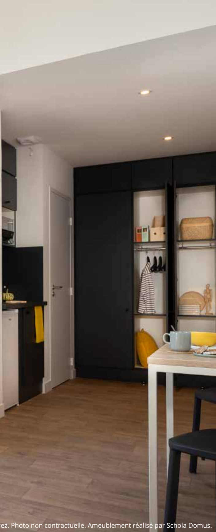
Photo non contractuelle. Ameublement réalisé par Schola Domus.