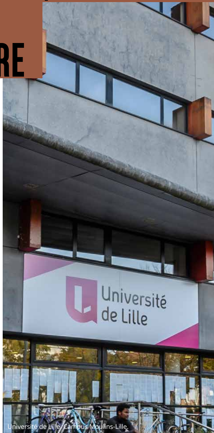
Université de Lille / Campus Moulins-Lille.

Énergique et moderne, la métropole est fortement plébiscitée par les étudiants et les jeunes actifs de par sa diversité d'infrastructures et d'offres de formation. Avec plus de 115 000 étudiants, de nombreux chercheurs et laboratoires de recherche, Lille bénéficie d'une belle réputation en matière d'enseignement supérieur, avec, outre ses universités, des écoles réputées comme l'EDHEC, Sciences Po Lille ou encore l'École nationale supérieure des Arts et Métiers.