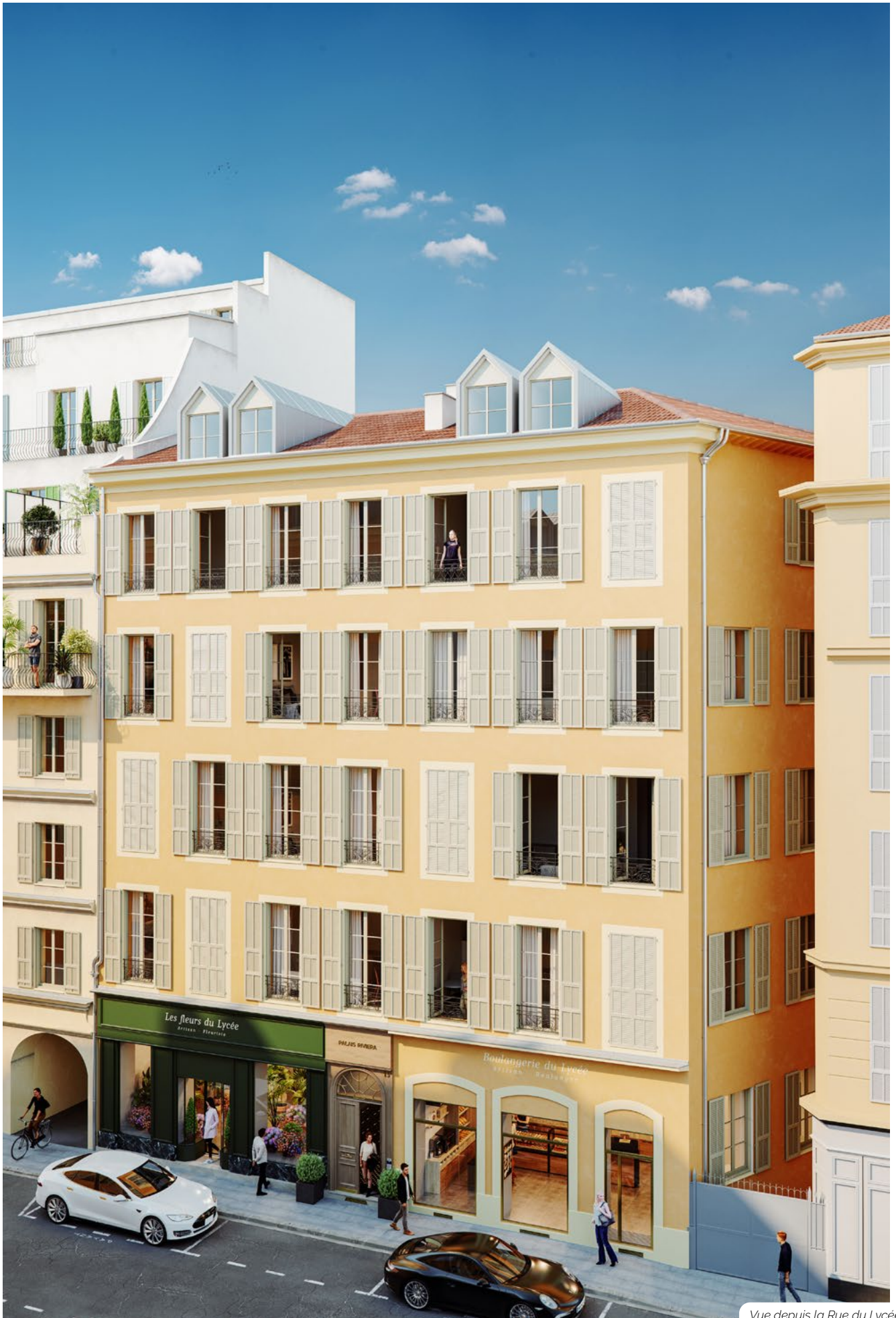
Vue depuis la Rue du Lycée