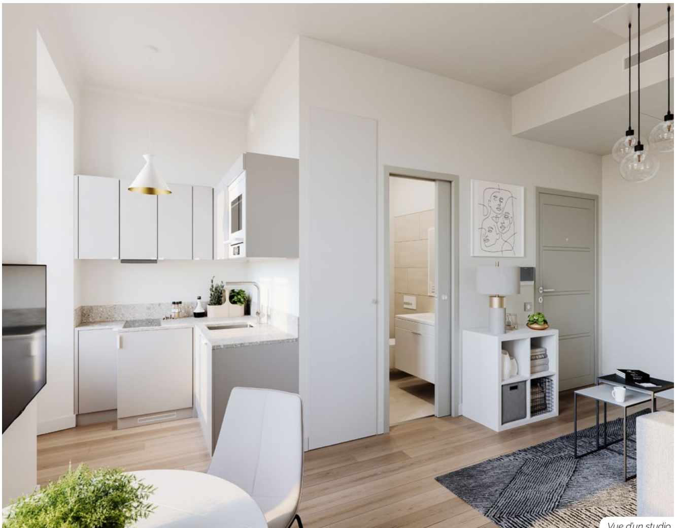
Vue d'un studio

Parfaits pour une location meublée, à destination du large public étudiant ou de voyageurs d'affaires, les appartements se prêtent également à la location saisonnière. Un investissement patrimonial stratégique, pérenne et harmonieux, à quelques pas de tous les hauts lieux de la vie niçoise.