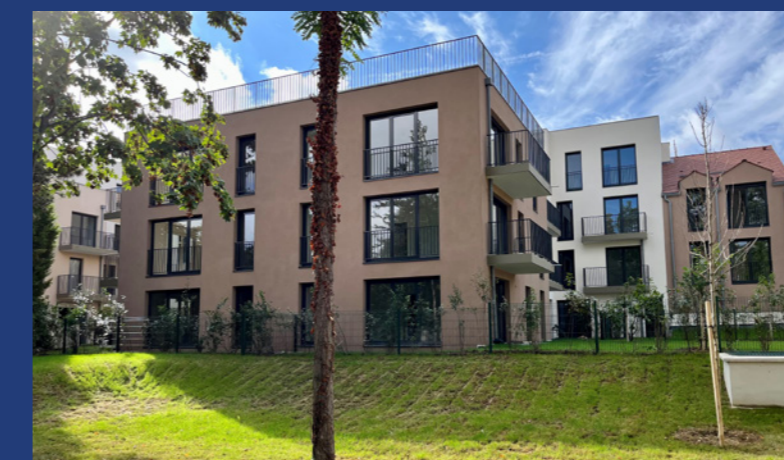
62 logements et 2 commerces à Chennevières-sur-Marne (94) – Livraison 2023

AIC partage avec ses partenaires professionnels les mêmes valeurs de rigueur, de responsabilité et de transparence pour la meilleure satisfaction de ses clients.