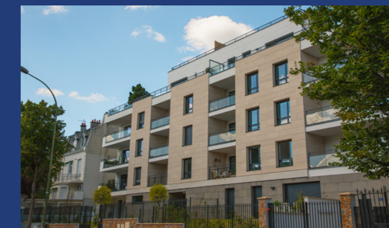
24 logements à Saint-Cloud (92) – Livraison 2020