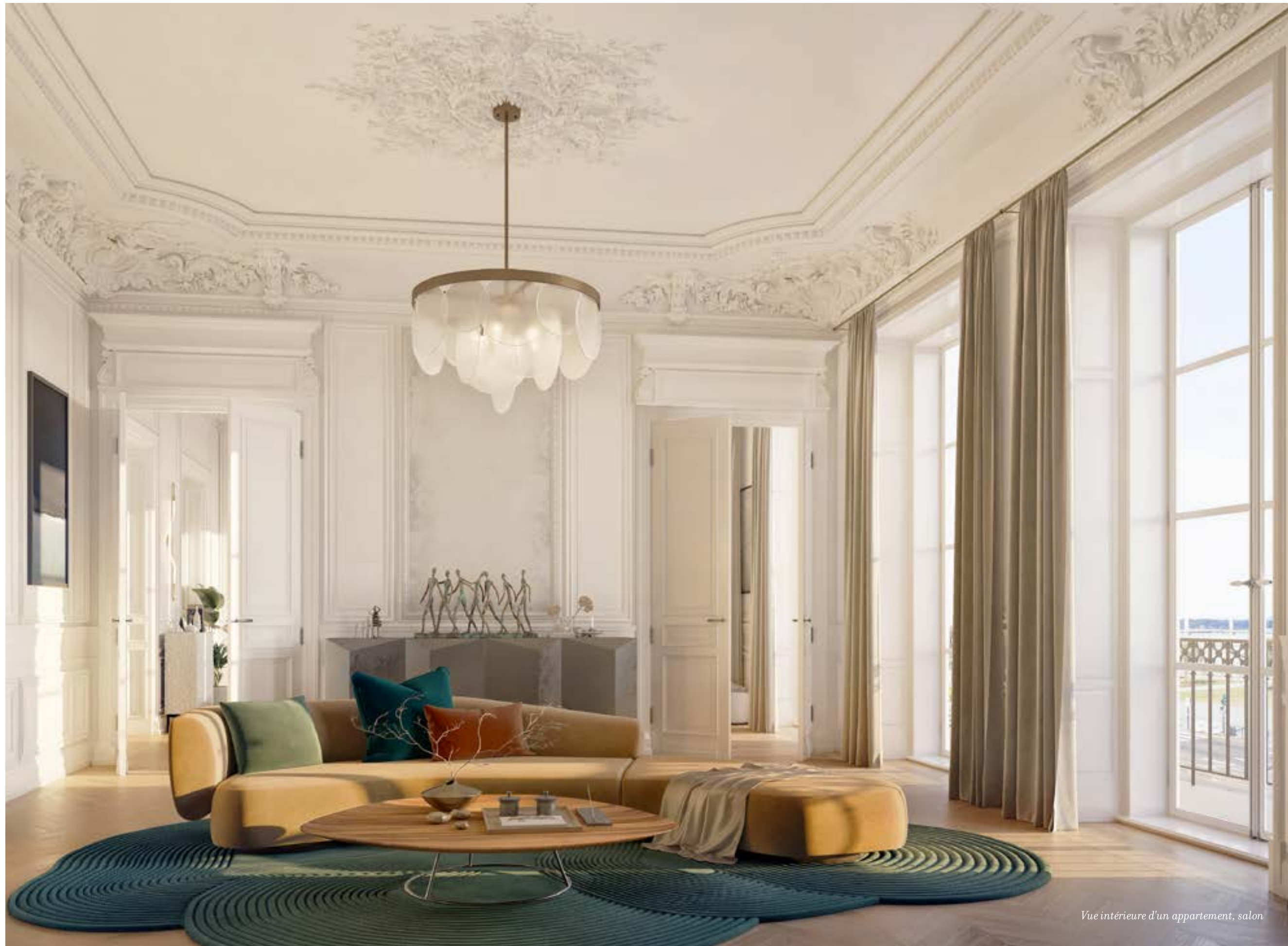
Vue intérieure d'un appartement, salon