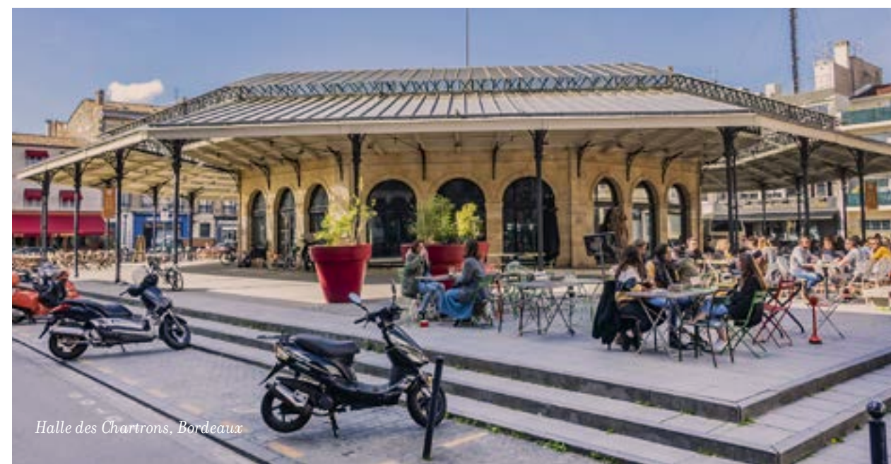
Halle des Chartrons, Bordeaux

C'est tout le charme de cette adresse exclusive. Vivre l'intensité bordelaise au cœur : l'effervescence de la place des Quinconces et des quais, l'animation des Halles et de la Cité du Vin, les spectacles de l'Arena et de l'Opéra et les embrasser au rythme du fleuve, entre deux ponts, à l'ombre des platanes, à pied ou à bicyclette.