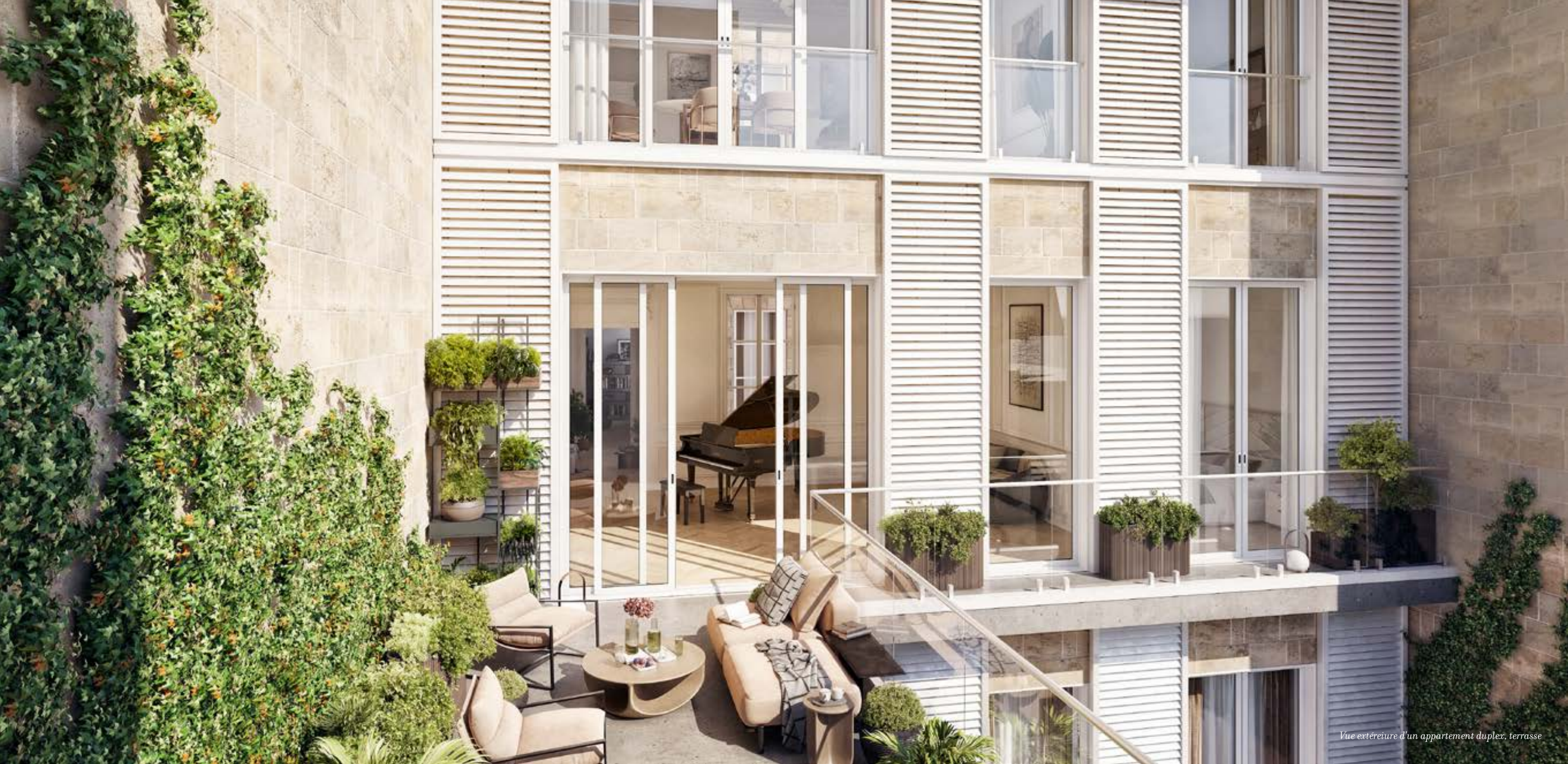
Vue extérieure d'un appartement duplex, terrasse

Un ciel ouvert, à la discrétion de la ville.