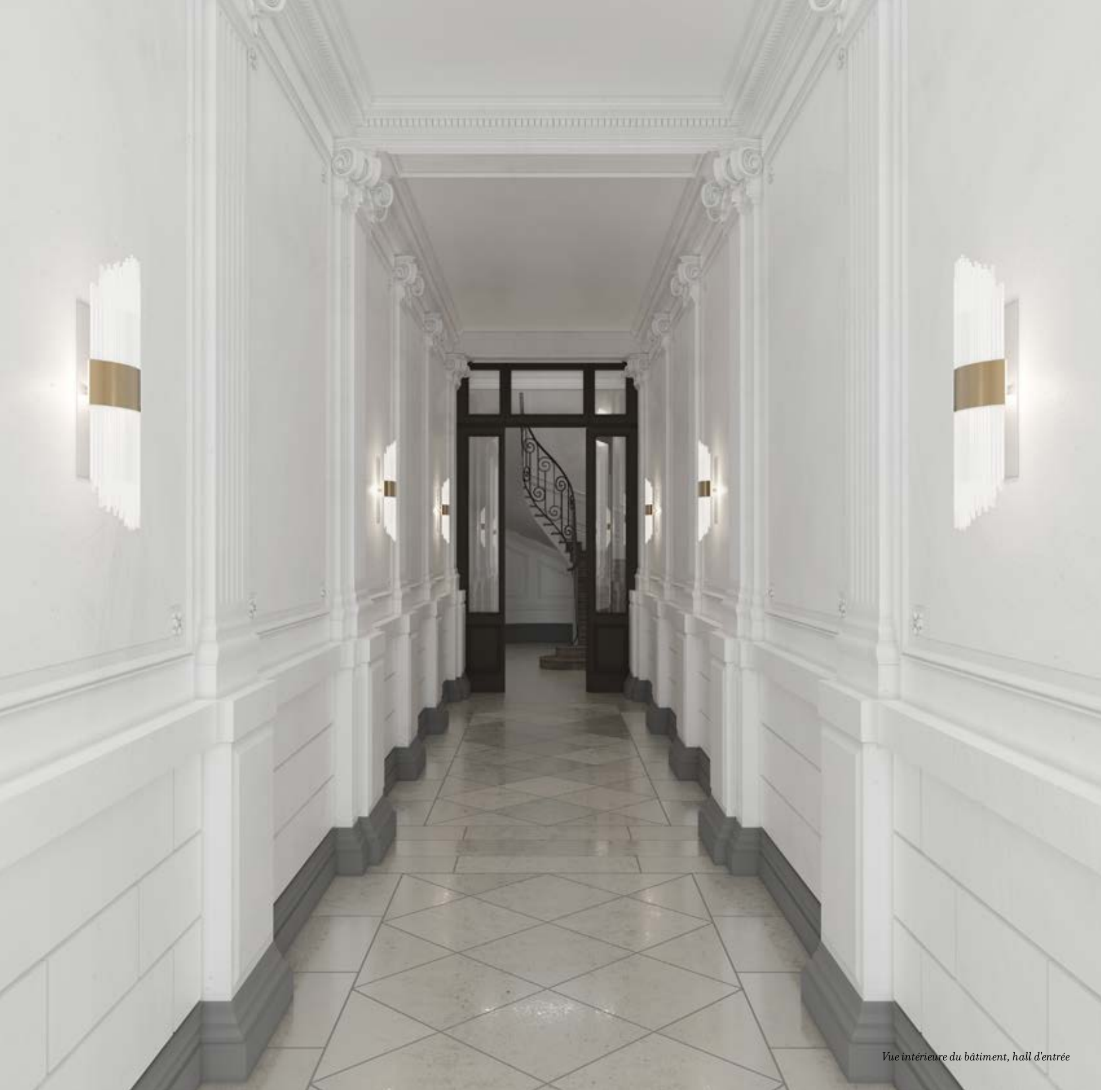
Vue intérieure du bâtiment, hall d'entrée