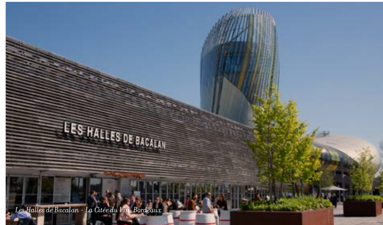
Les Halles de Bacalan - La Cité du Vin, Bordeaux