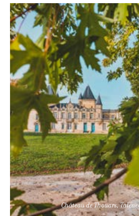
Château de Thouars, Talence