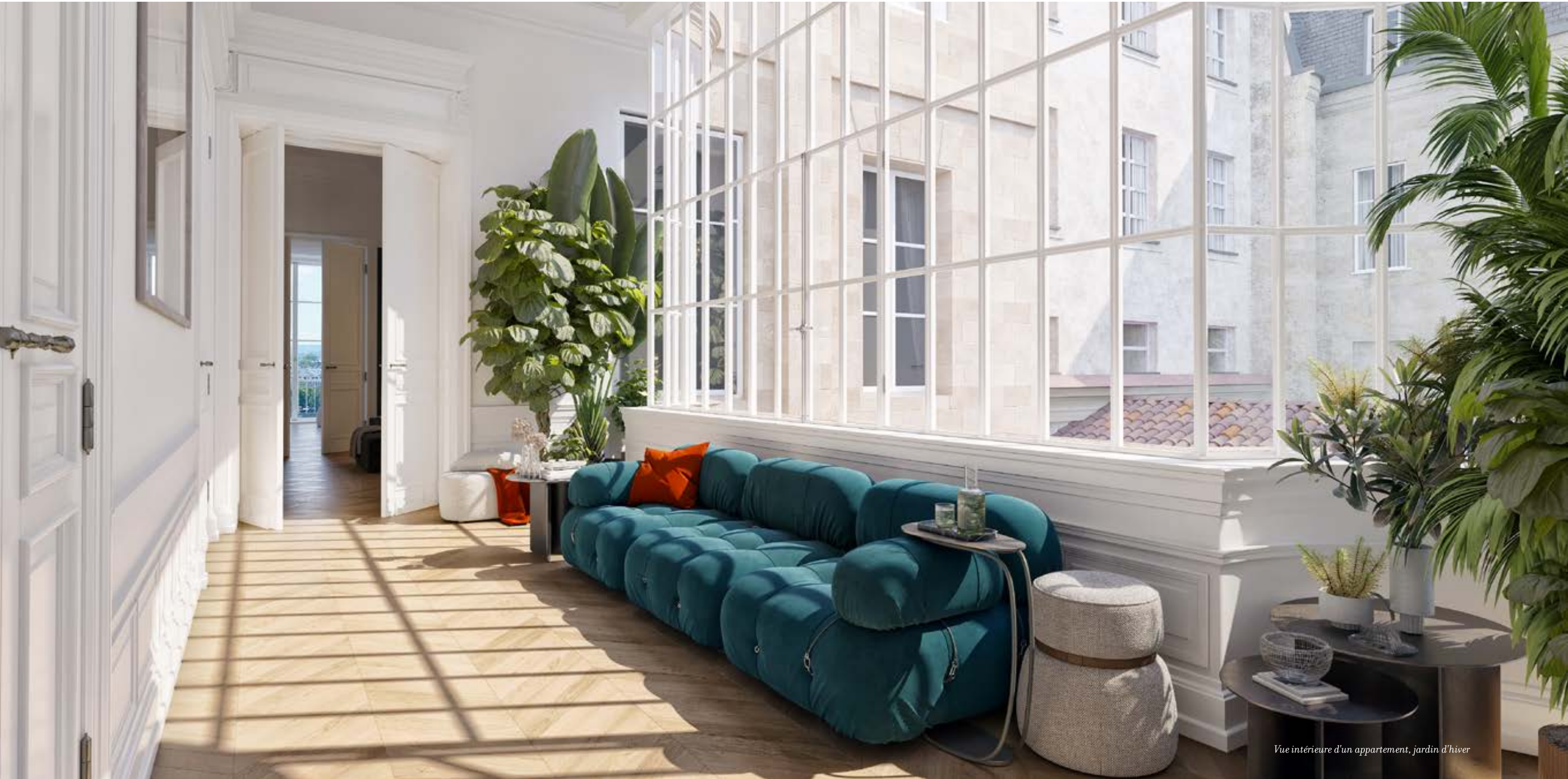
Vue intérieure d'un appartement, jardin d'hiver

Prendre un bain de soleil quand il fait froid dehors, buller, bouquiner, jardiner, méditer... ou tout simplement ne rien faire, le tout avec volupté. Voilà qui promet de jolis moments entre soi, le lieu y est propice.