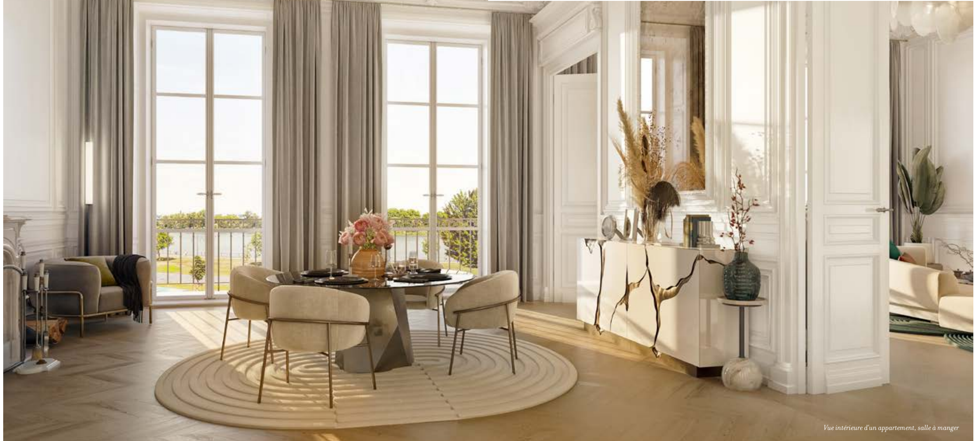
Vue intérieure d'un appartement, salle à manger

La Garonne est là , la fenêtre en face, ouvrant les perspectives, apaisant les humeurs. Entre vous et elle, il n'y a rien, seulement les quais à vos pieds. C'est ici que vous aimez recevoir, dans cet espace infini habillé de belles matières, éclairé avec intelligence et du bout des doigts.