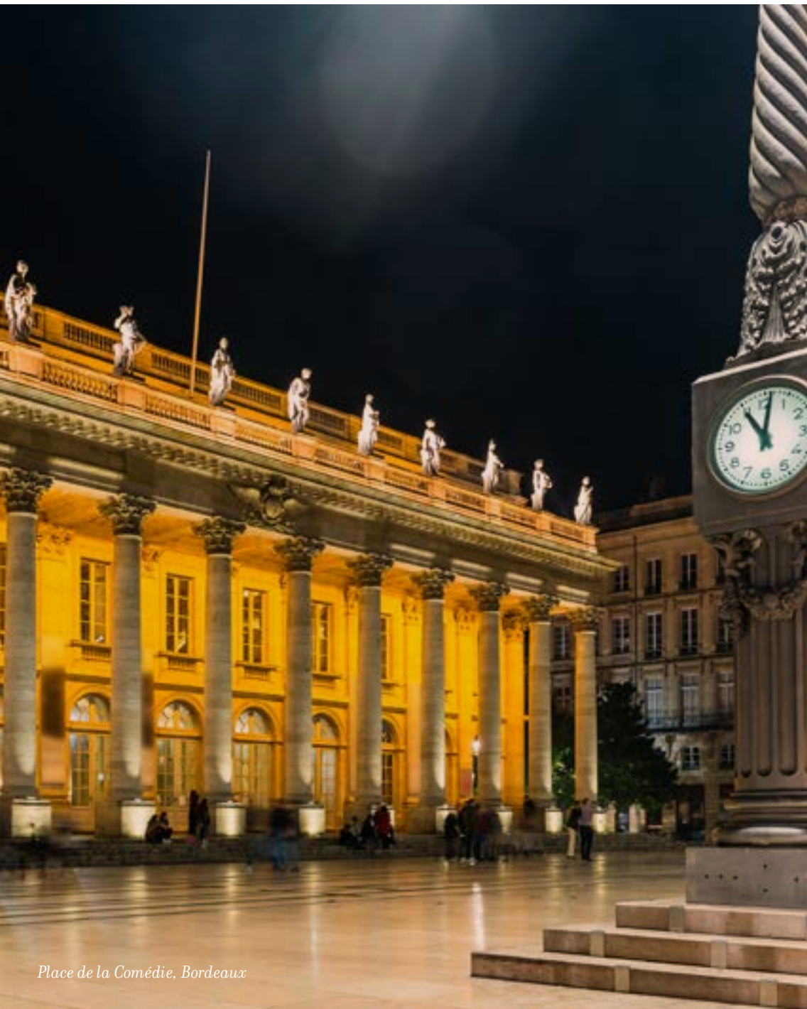
Place de la Comédie, Bordeaux