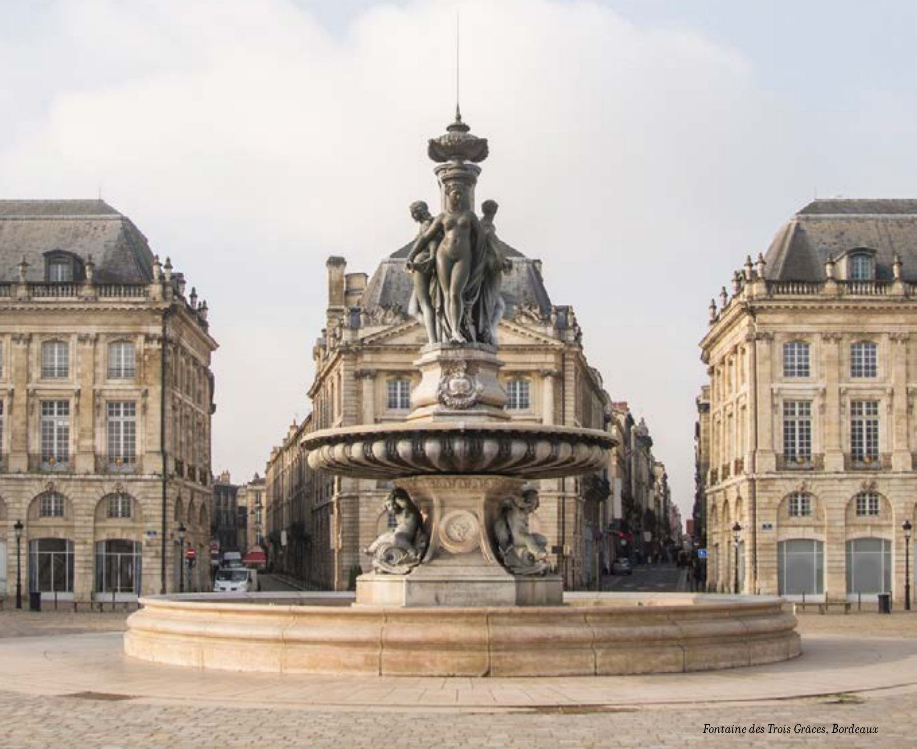
Fontaine des Trois Grâces, Bordeaux

Après Paris , le fantasme français lui doit beaucoup. Berceau des plus grands vins du monde, de la gastronomie et des grandes maisons de luxe, la Nouvelle-Aquitaine fascine et continue son ascension. C'est une terre grandiose et la plus grande des régions de France, déroulant une mosaïque de paysages et de richesses sur 84 000 km 2 de terre attractive. Des pays basques pittoresques aux marais poitevins secrets, de la vallée de la Dordogne, à celle du Lot, des sommets pyrénéens à la dune du Pilat, de Bordeaux monumentale à La Rochelle maritime... elle offre tout ce que la France a de plus beau, le pays bordelais en tête de proue.