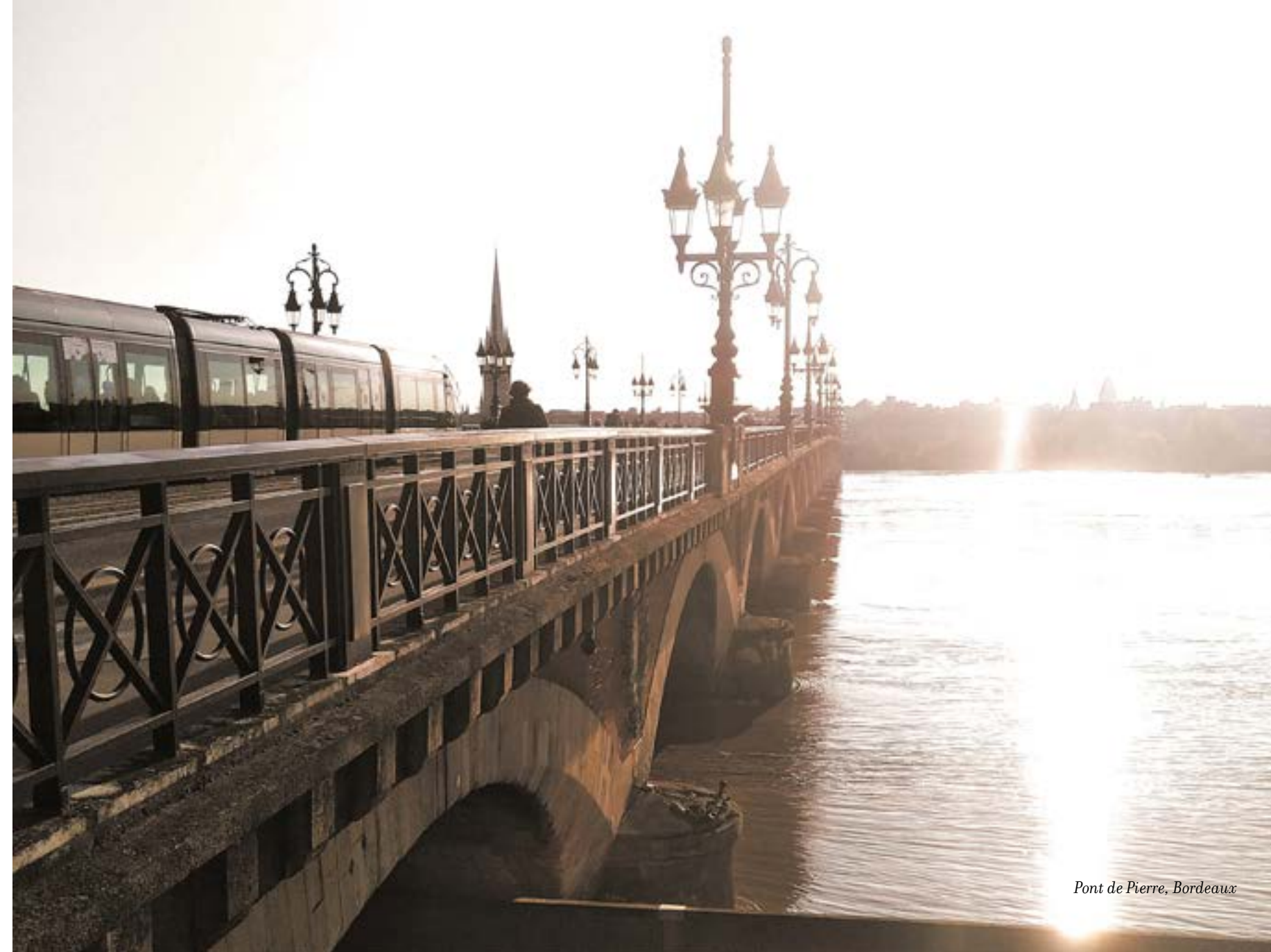
Pont de Pierre, Bordeaux

Bordeaux est une belle éveillée qui incarne à merveille le concept tant recherché de slow life .