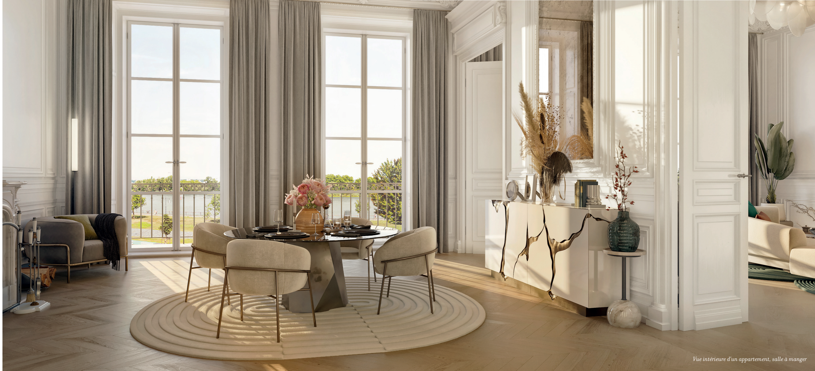
Vue intérieure d'un appartement, salle à manger

La Garonne est là, la fenêtre en face, ouvrant les perspectives, apaisant les humeurs. Entre vous et elle, il n'y a rien, seulement les quais à vos pieds. C'est ici que vous aimez recevoir, dans cet espace infini habillé de belles matières, éclairé avec intelligence et du bout des doigts.