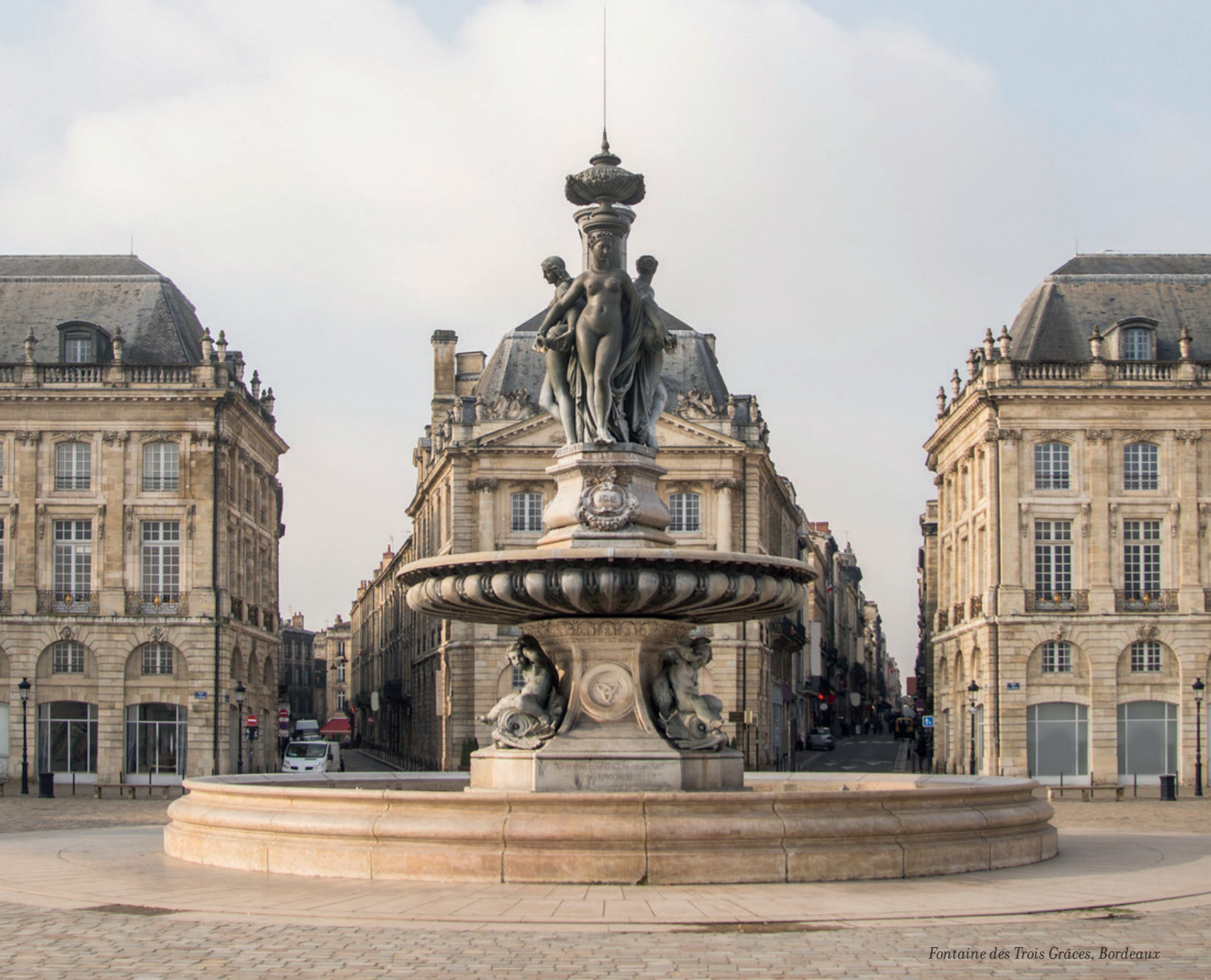
Fontaine des Trois Grâces, Bordeaux

Après Paris , le fantasme français lui doit beaucoup. Berceau des plus grands vins du monde, de la gastronomie et des grandes maisons de luxe, la Nouvelle-Aquitaine fascine et continue son ascension. C'est une terre grandiose et la plus grande des régions de France, déroulant une mosaïque de paysages et de richesses sur 84 000 km 2 de terre attractive. Des pays basques pittoresques aux marais poitevins secrets, de la vallée de la Dordogne, à celle du Lot, des sommets pyrénéens à la dune du Pilat, de Bordeaux monumentale à La Rochelle maritime... elle offre tout ce que la France a de plus beau, le pays bordelais en tête de proue.