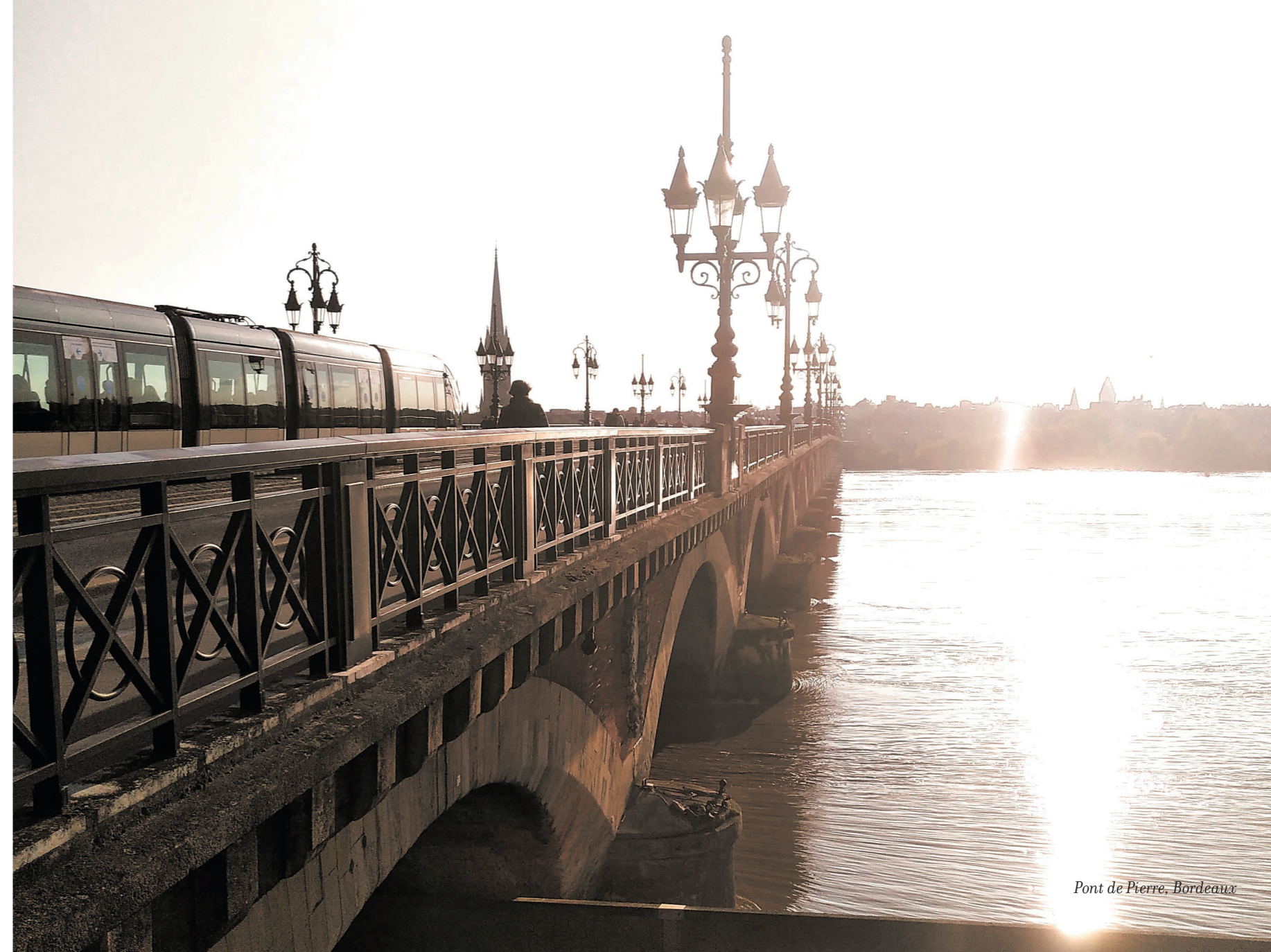
Pont de Pierre, Bordeaux

Bordeaux est une belle éveillée qui incarne à merveille le concept tant recherché de slow life .