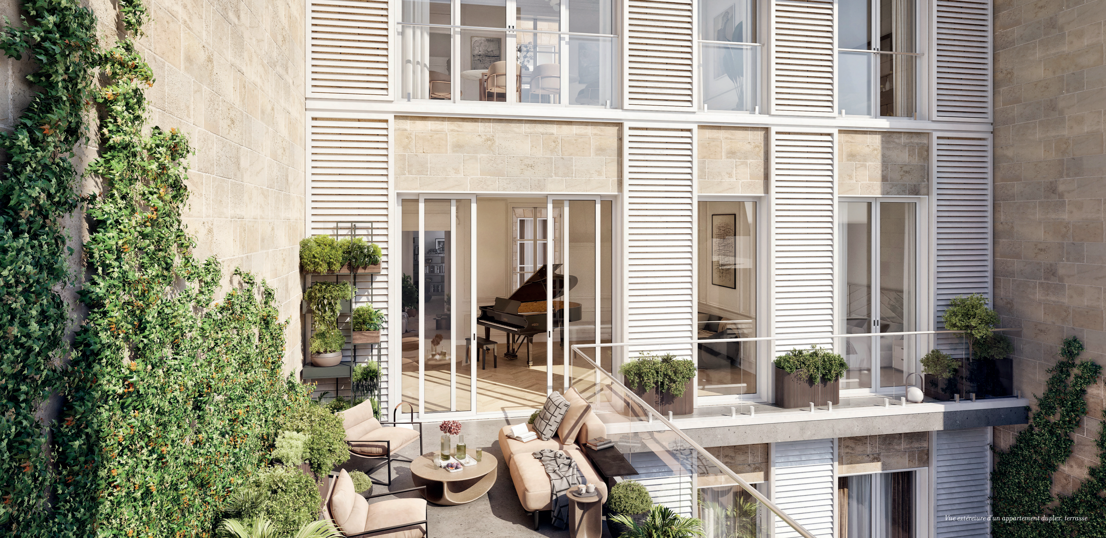
Vue extérieure d'un appartement duplex, terrasse

Un ciel ouvert, à la discrétion de la ville.