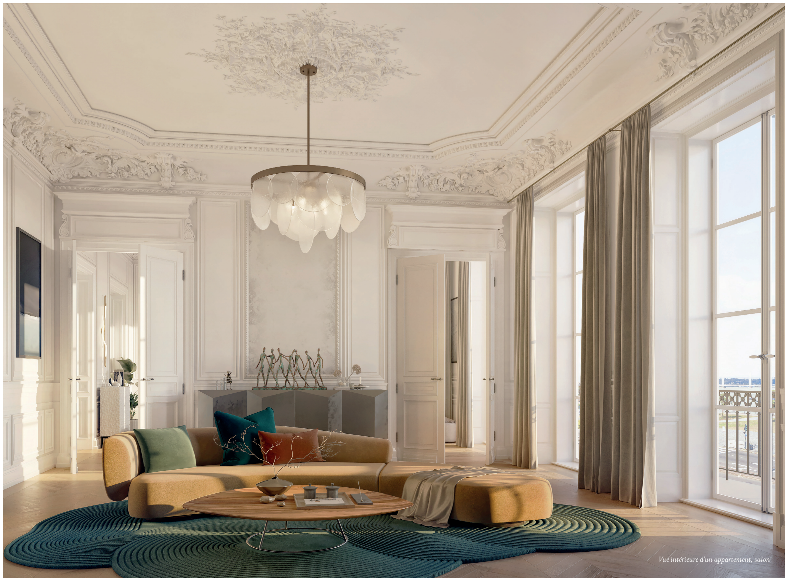
Vue intérieure d'un appartement, salon