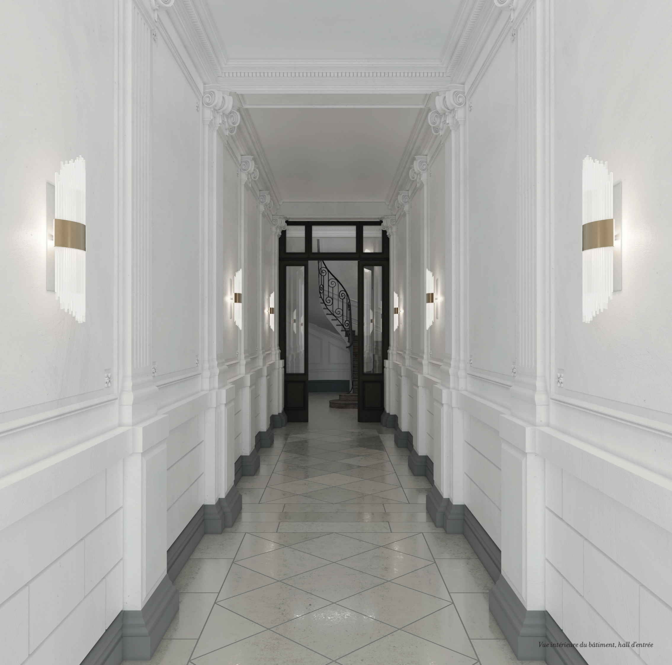
Vue intérieure du bâtiment, hall d'entrée