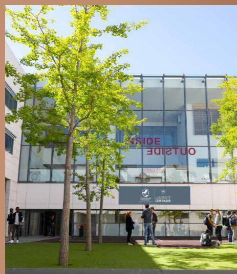
Campus Saint Jean d'Angély

La Promenade des Anglais offre une balade avec la mer à perte de vue tandis que le Vieux Nice dévoile son histoire, sa gastronomie et sa culture. La ville dispose de nombreux moyens de mobilité, que ce soit pour le travail, la détente ou le shopping et offre un patrimoine de qualité pour vivre ou pour investir.