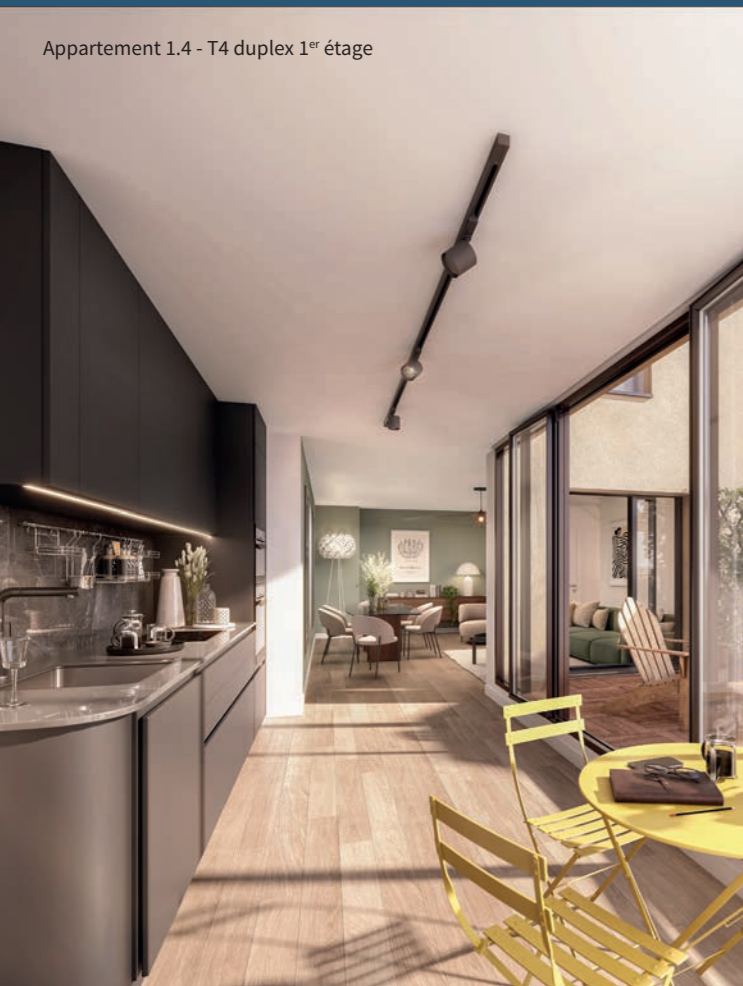
Appartement 1.4 - T4 duplex 1 er étage