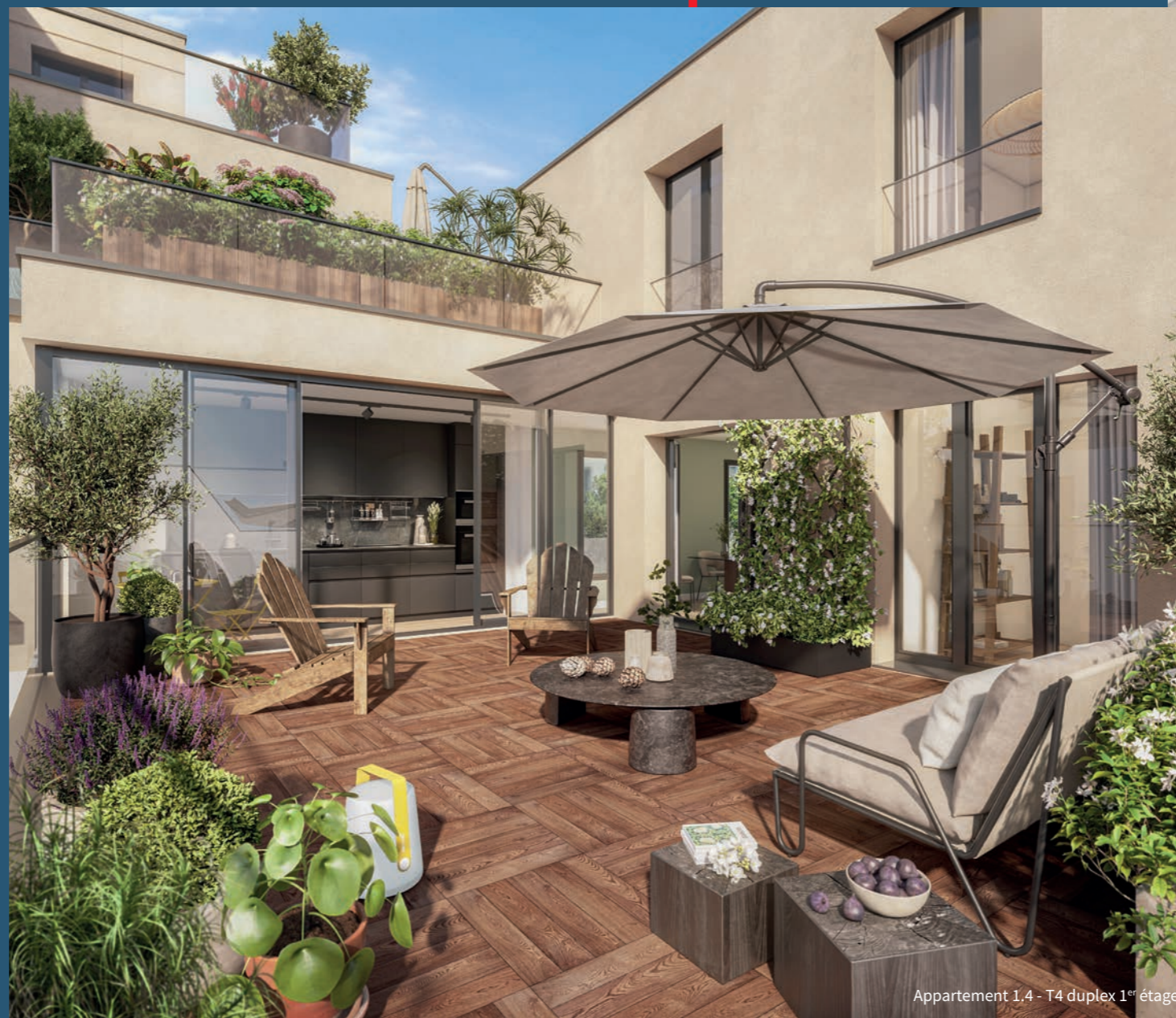
Appartement 1.4 - T4 duplex 1 er étage