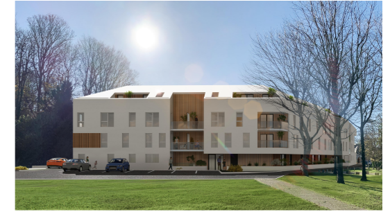
Ville de Mont-Saint-Aignan Chemin de la Planquette