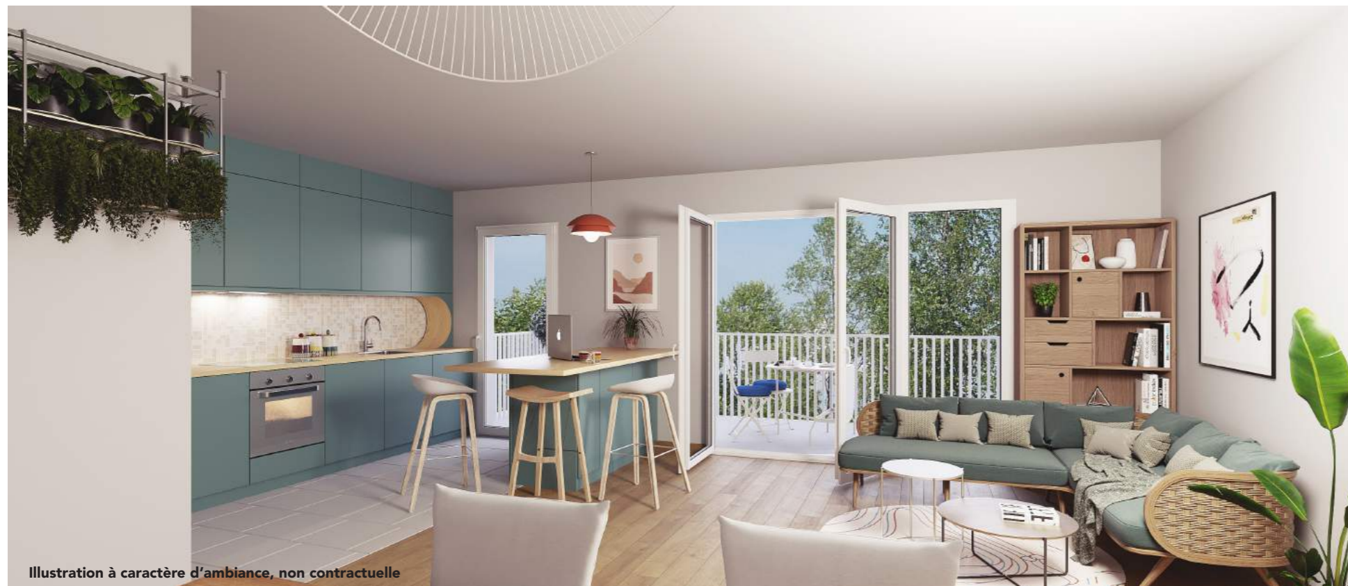
Illustration à caractère d'ambiance, non contractuelle