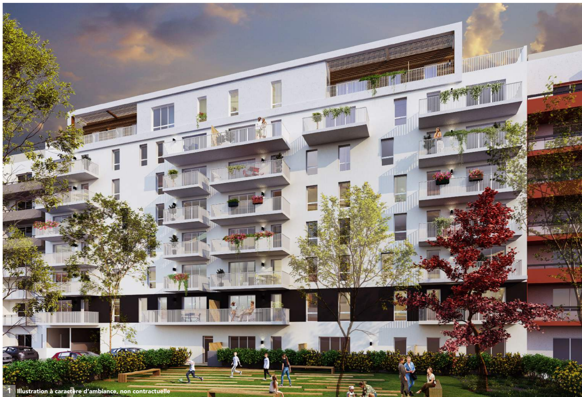
1 Illustration à caractère d'ambiance, non contractuelle