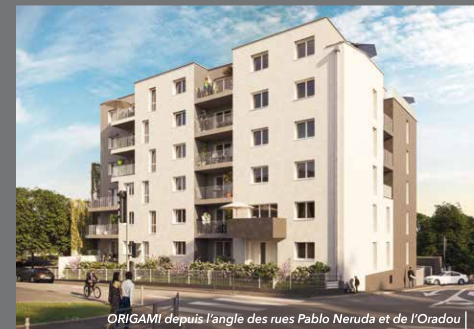
ORIGAMI depuis l'angle des rues Pablo Neruda et de l'Oradou