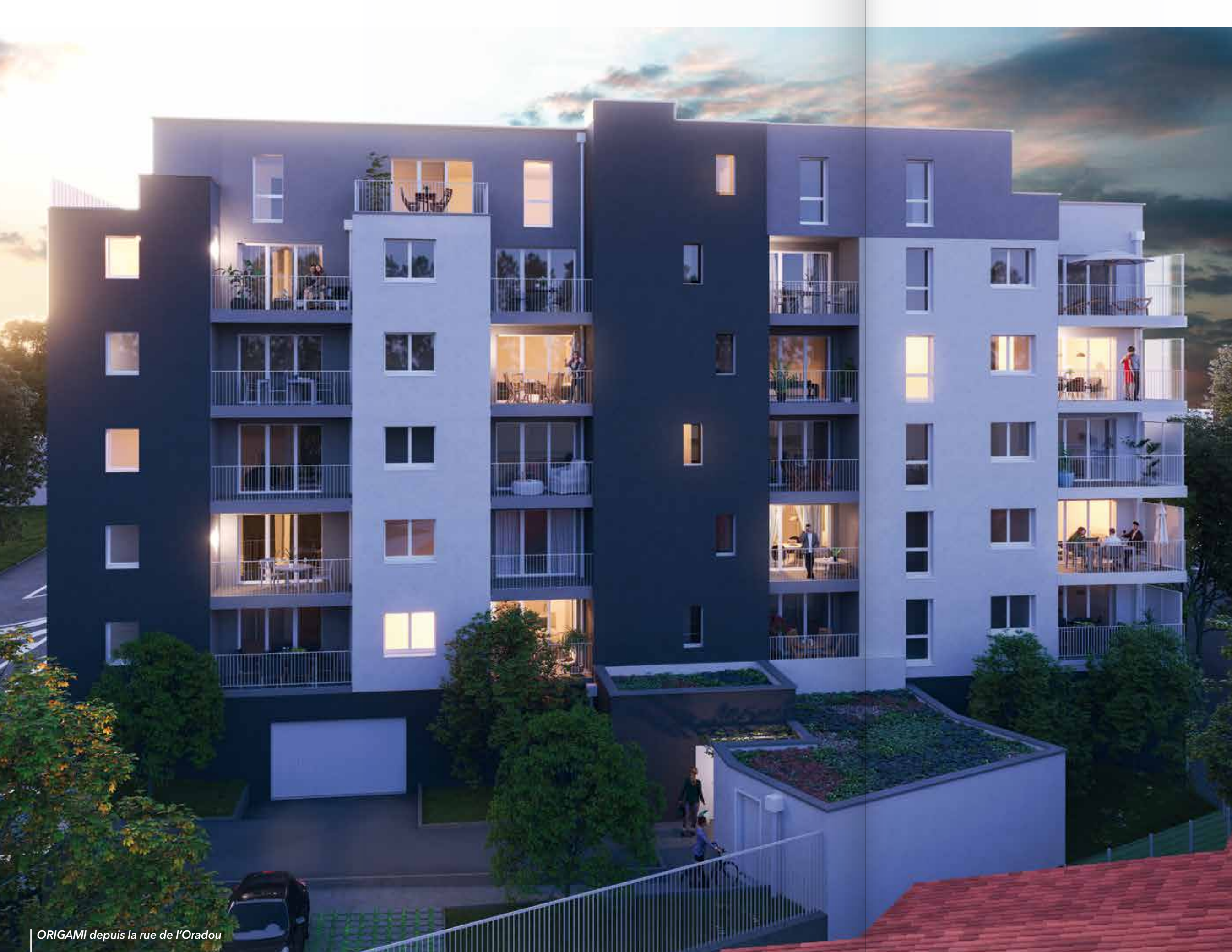
ORIGAMI depuis la rue de l'Oradou