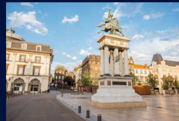
Place de Jaude

La résidence VERS'O se dévoile dans le très convoité quartier des Salins, à moins de dix minutes à pied du centre-ville et de la place de Jaude. Ce secteur résidentiel, en cours d'aménagement, dans la lignée du futur grand espace piétonnisé paysager, place de Regensburg, attire étudiants, jeunes actifs et familles pour les nombreux avantages qu'il présente : commerces, stade nautique Pierre de Coubertin, groupes scolaires, espaces culturels (Comédie de Clermont-Ferrand), jardin Lecoq, université Clermont Auvergne... et l'immanquable marché aux puces de la place Gambetta, attirant chaque dimanche nombre d'habités.