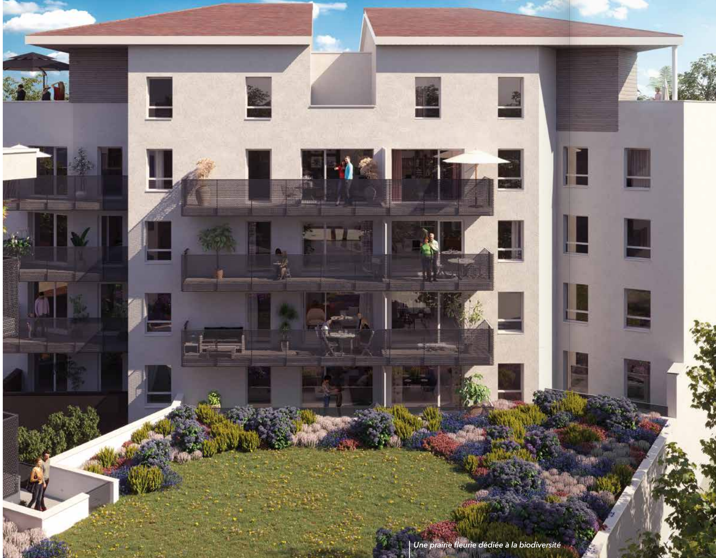
Une prairie fleurie dédiée à la biodiversité