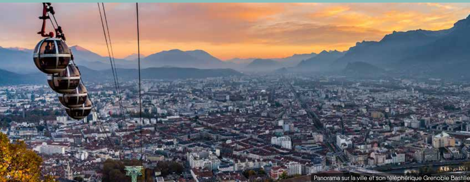
Panorama sur la ville et son téléphérique Grenoble Bastille