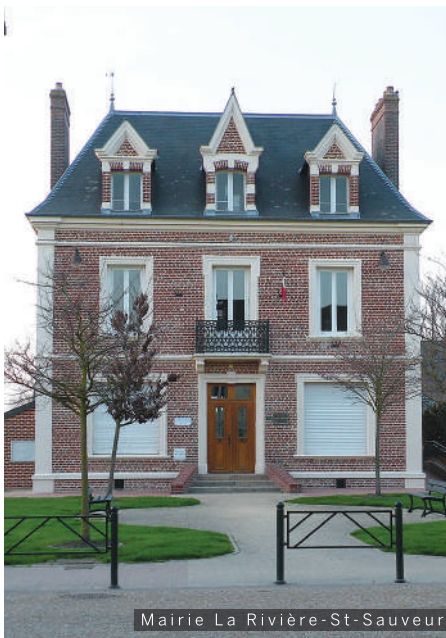
Mairie La Rivière-St-Sauveur