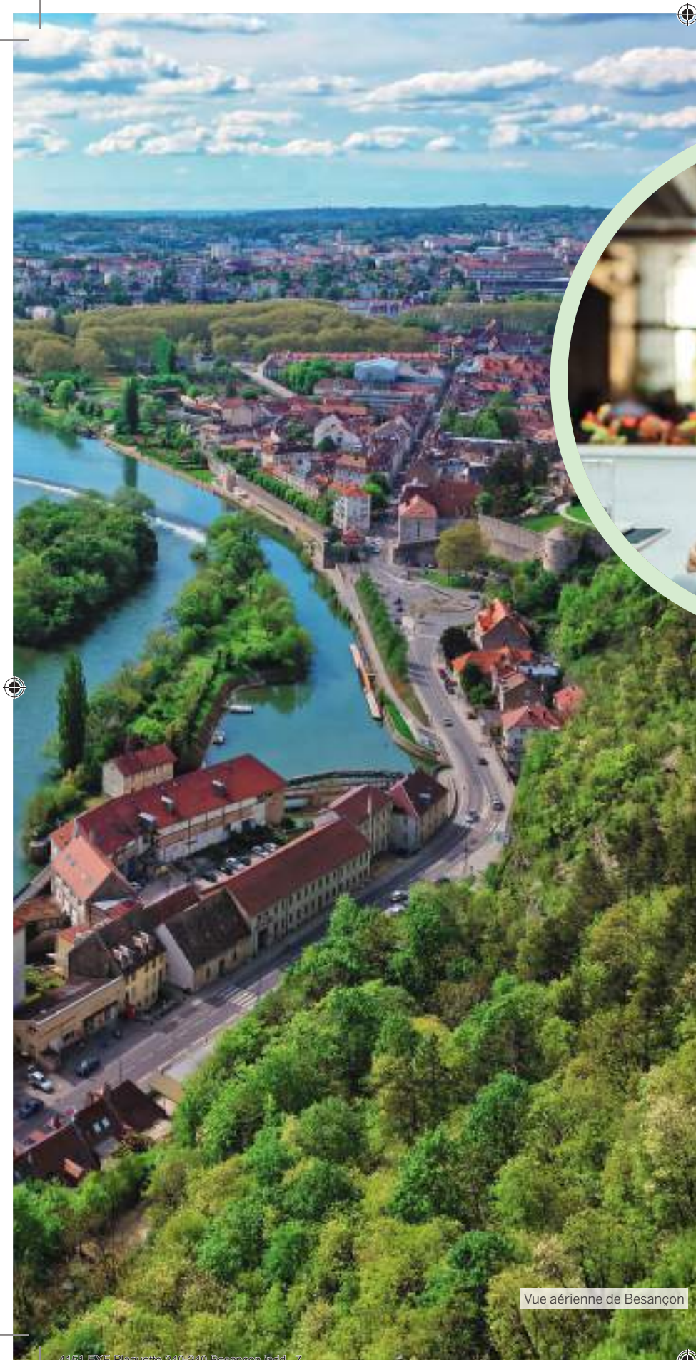
Vue aérienne de Besançon