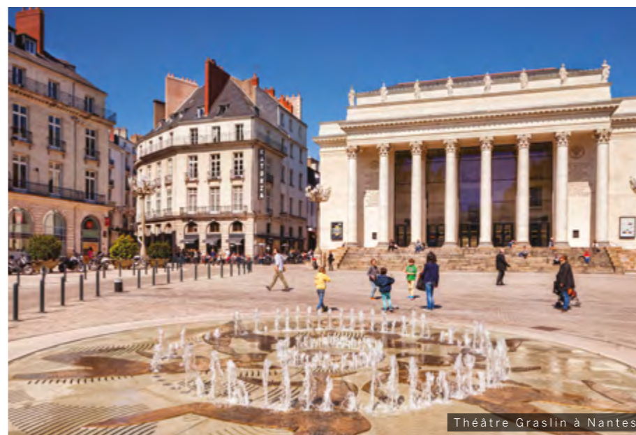
Théâtre Graslin à Nantes

À seulement 15 min* de Nantes, Héric comble les familles en quête d'une douceur de vivre préservée . Son cadre de vie paisible et verdoyant offre un agréable dépaysement aux portes de l'agglomération nantaise.