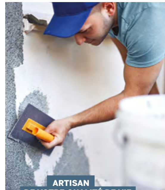
ARTISAN DE VOTRE QUALITÉ DE VIE À HÉRIC