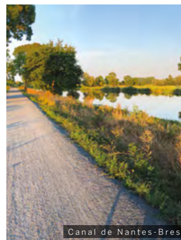
Canal de Nantes-Brest