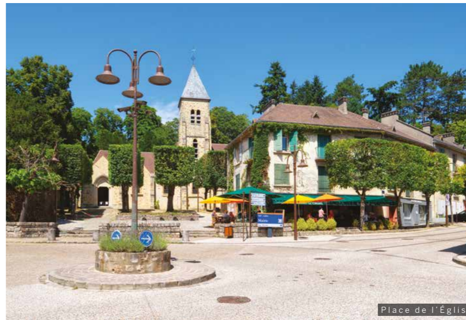
Place de l'Église

Aux portes de la Vallée de Chevreuse et à seulement 23 km* de Paris, Gif-sur-Yvette est restée une commune verdoyante et conviviale, fière de son esprit village . Ce cadre de vie préservé enchante les familles en quête de bien-être, tout comme les actifs, qui s'assurent la proximité du Plateau de Saclay . Ce pôle scientifique d'excellence est composé d' universités des plus reconnues , d'instituts de recherche et d' entreprises allant de la start-up au grand groupe international du CAC 40 .