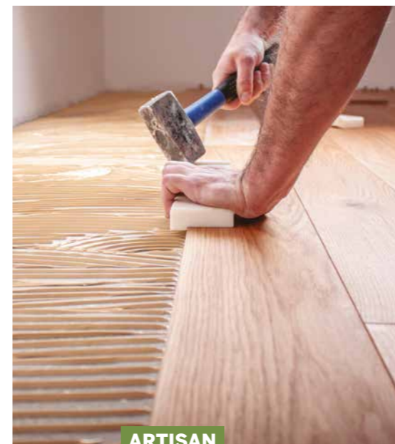
ARTISAN DE VOTRE QUALITÉ DE VIE À GIF-SUR-YVETTE