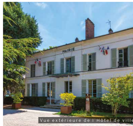
Vue extérieure de l'Hôtel de ville