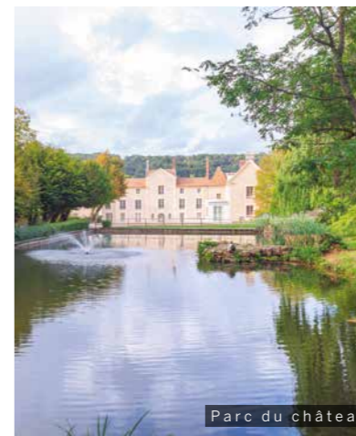
Parc du château