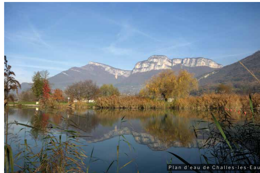
Plan d'eau de Challes-les-Eaux