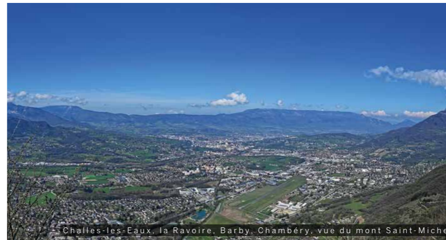
Challes-les-Eaux, la Ravoire, Barby, Chambéry, vue du mont Saint-Michel