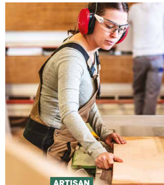
ARTISAN DE VOTRE QUALITÉ DE VIE À CHALLES-LES-EAUX