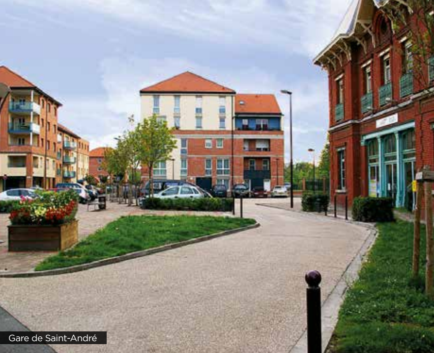
Gare de Saint-André