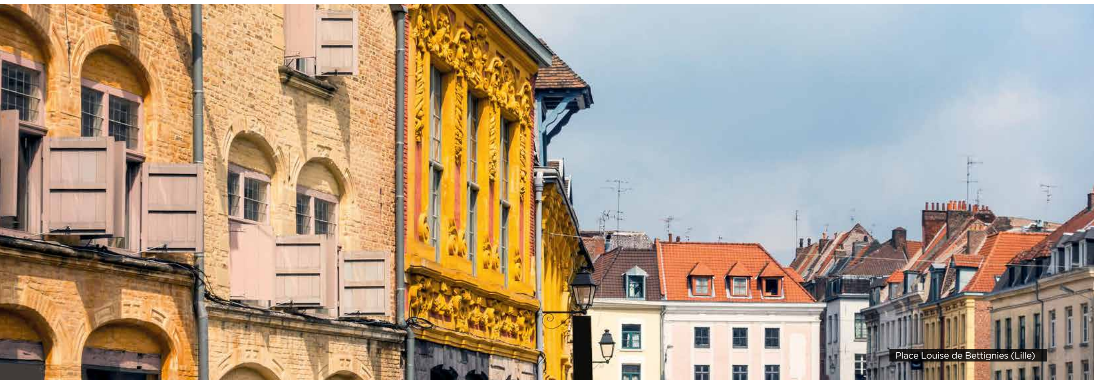
Place Louise de Bettignies (Lille)