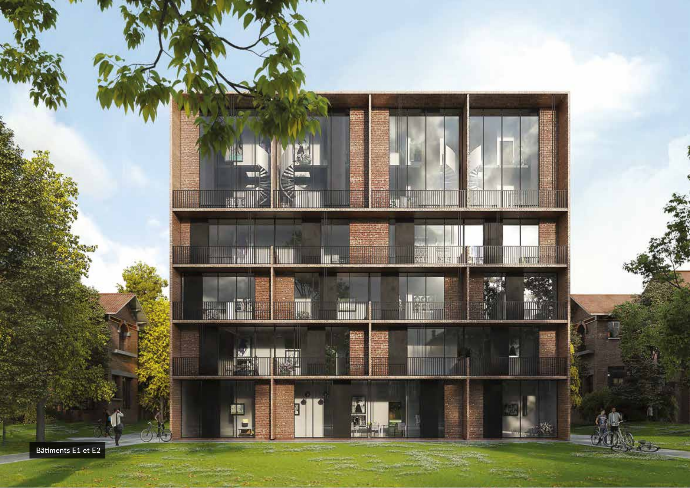
Bâtiments E1 et E2