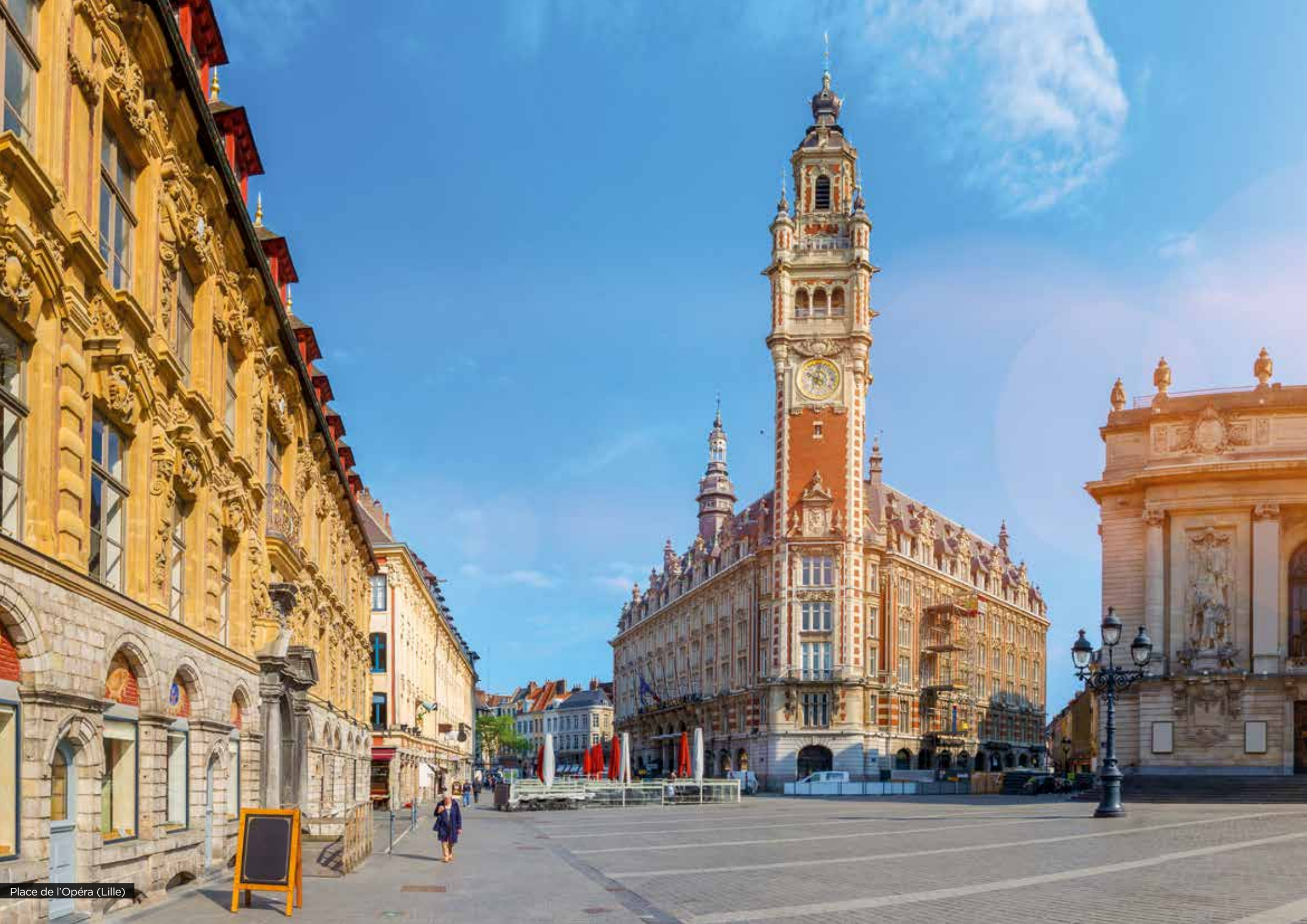
Place de l'Opéra (Lille)