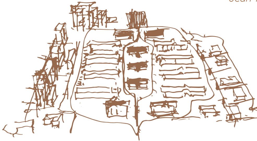
Esquisse de la résidence réalisée par Jean-Michel WILMOTTE