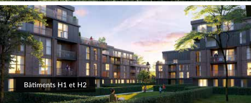
Bâtiments H1 et H2