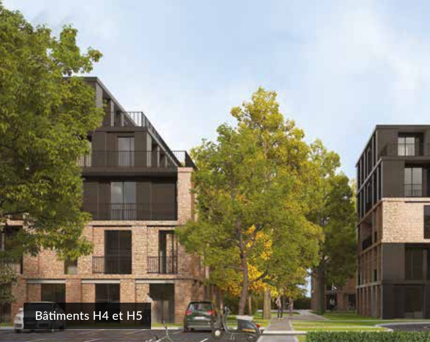
Bâtiments H4 et H5

Clément Large – Architecte Paysagiste Neveux-Rouyer