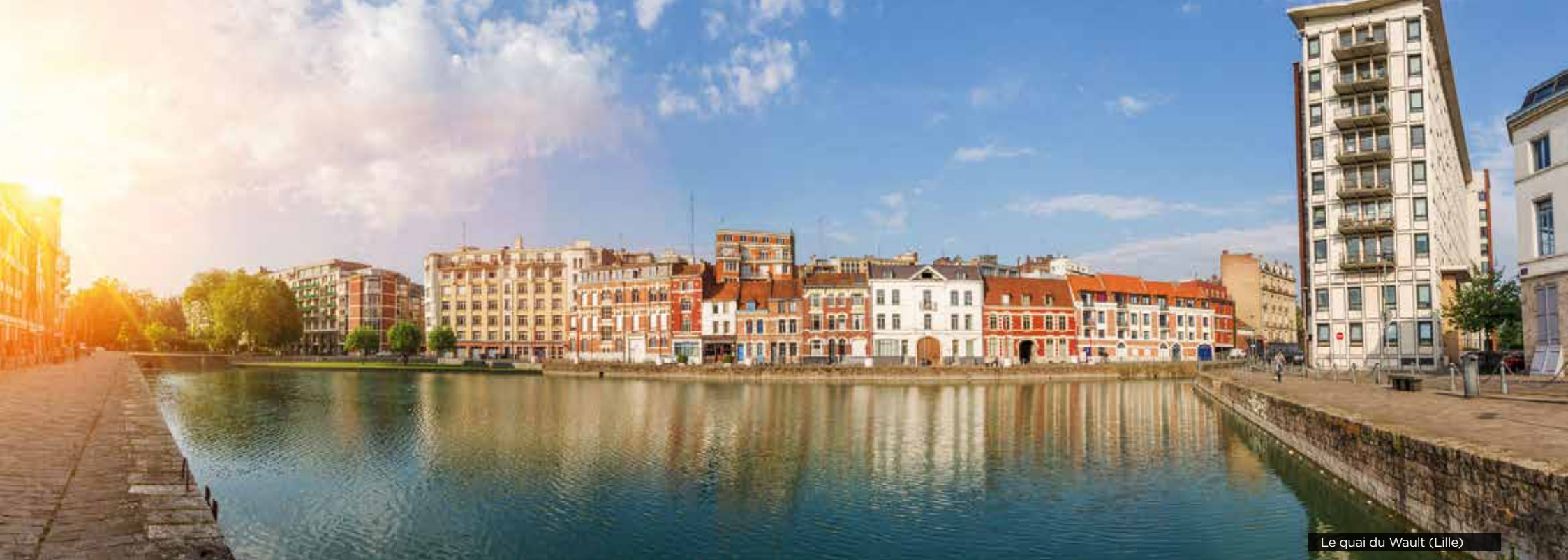
Le quai du Wault (Lille)