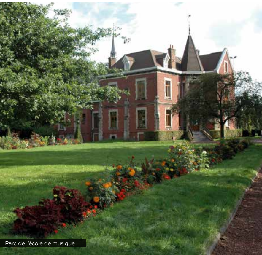
Parc de l'école de musique