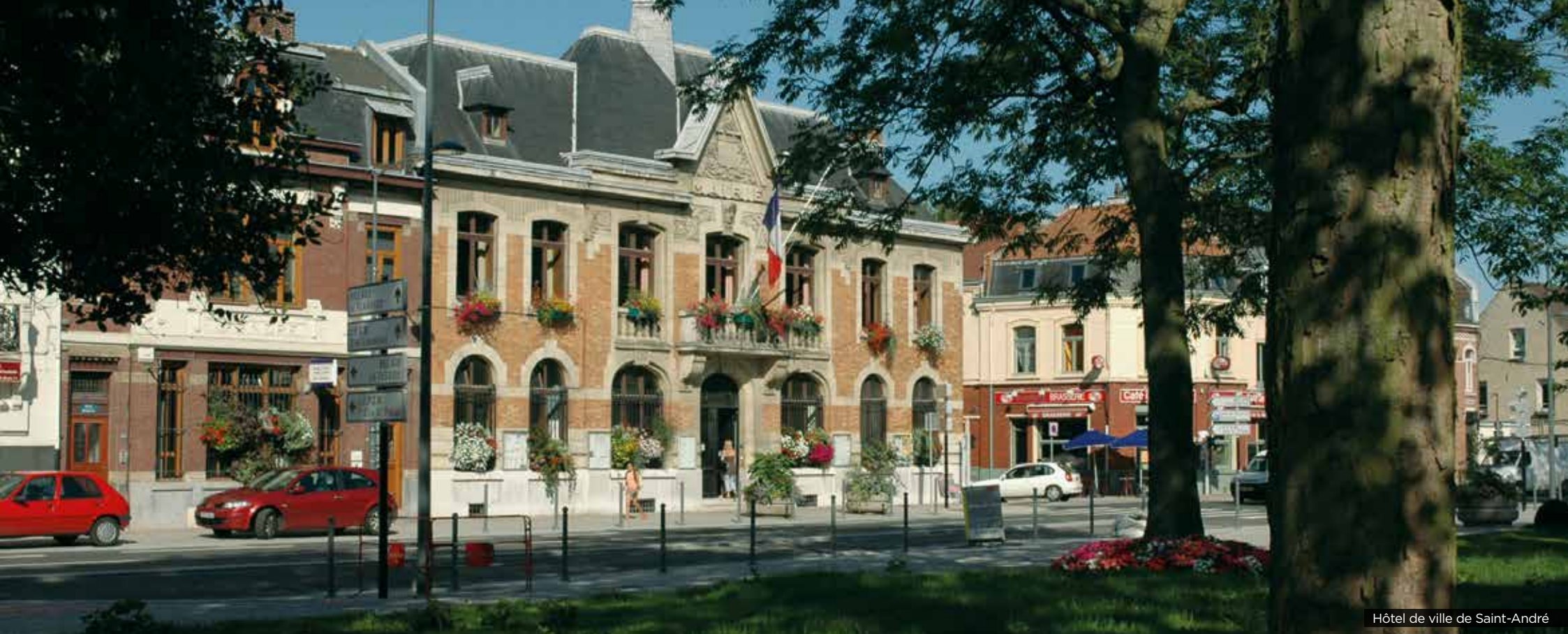
Hôtel de ville de Saint-André