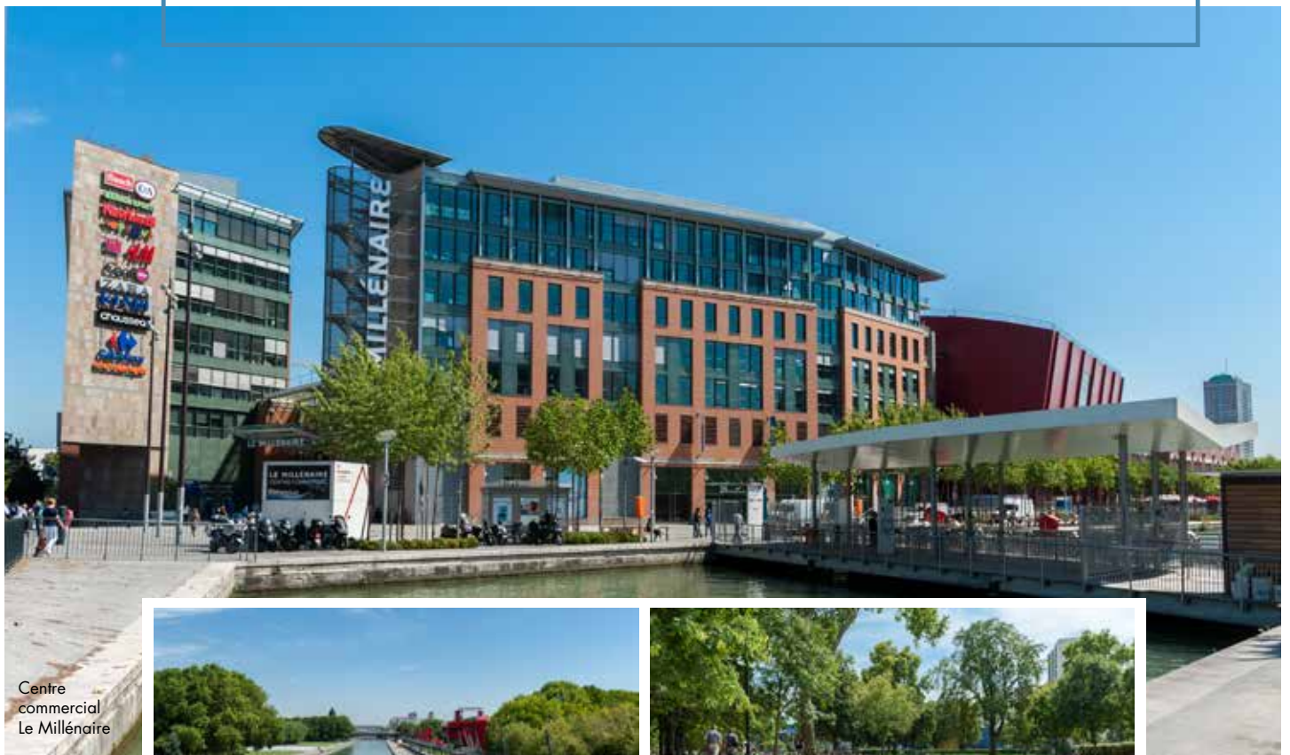
Centre commercial Le Millénaire

Aubervilliers s'inscrit depuis plusieurs années dans un programme ambitieux de développement. Parfaitement connectée à la métropole grâce à 2 gares de RER, 2 lignes de métro, la ligne 3 du tramway et de nombreuses lignes de bus, cette ville cosmopolite a su attirer les sièges sociaux de grands groupes tels que Véolia. Siège de 30 000 emplois et 1 800 entreprises, elle séduit les actifs par son dynamisme reconnu !