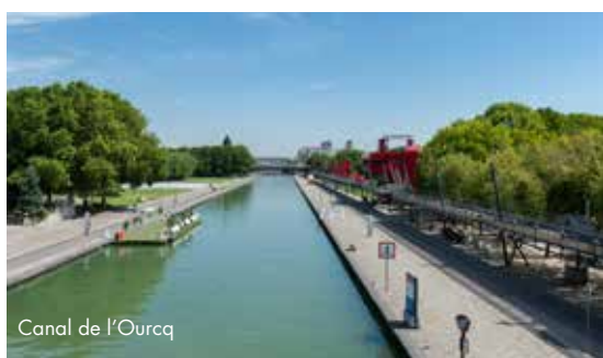
Canal de l'Ourcq