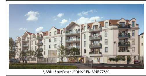
3, 3Bis, 5 rue Pasteur ROISSY-EN-BRIE 77680