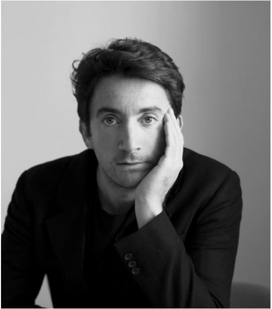
Martin DUPLANTIER Architecte

Le bâtiment se lit comme une pliure en briques, en résonance avec l’ambiance du quartier. Il est érigé avec une faible empreinte carbone, marquant un renouveau en prise avec la longue histoire de la ville. »