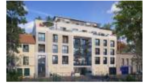
Construction d'un immeuble de logements 9, 11, 13 rue de Lorraine 78200 Mantès-la-Jolie