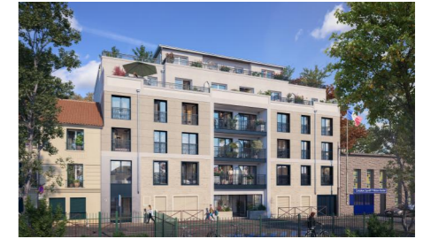
Construction d'un immeuble de logements 9, 11, 13 rue de Lorraine 78200 Mantès-la-Jolie