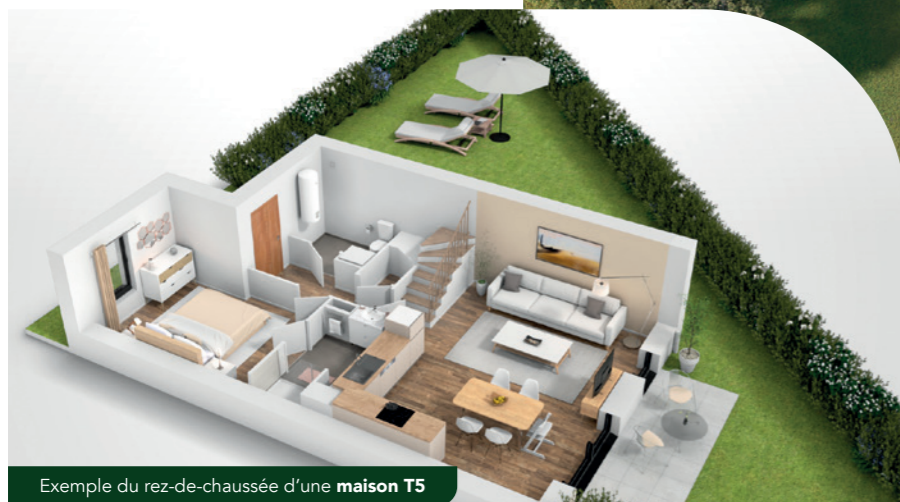
Exemple du rez-de-chaussée d'une maison T5