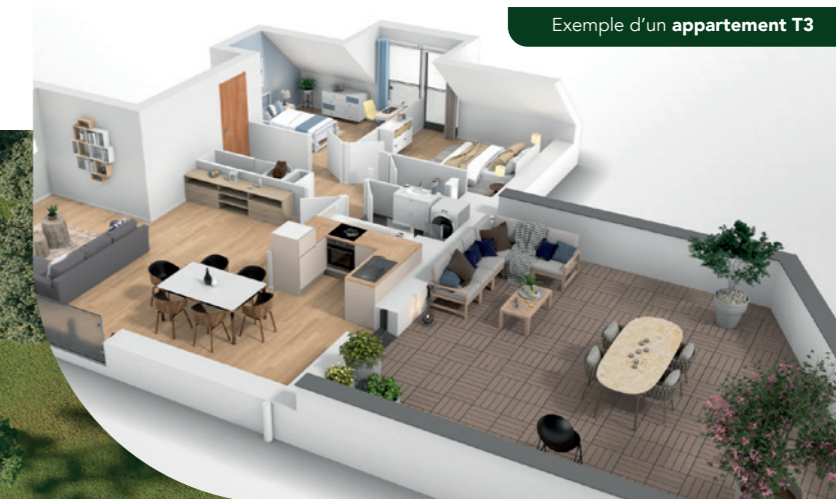
Exemple d'un appartement T3