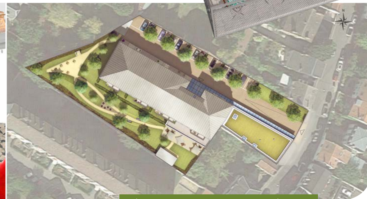
Résidence seniors, rue des Cordeliers à Meaux