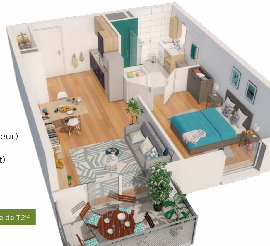
Exemple de T2 (2)