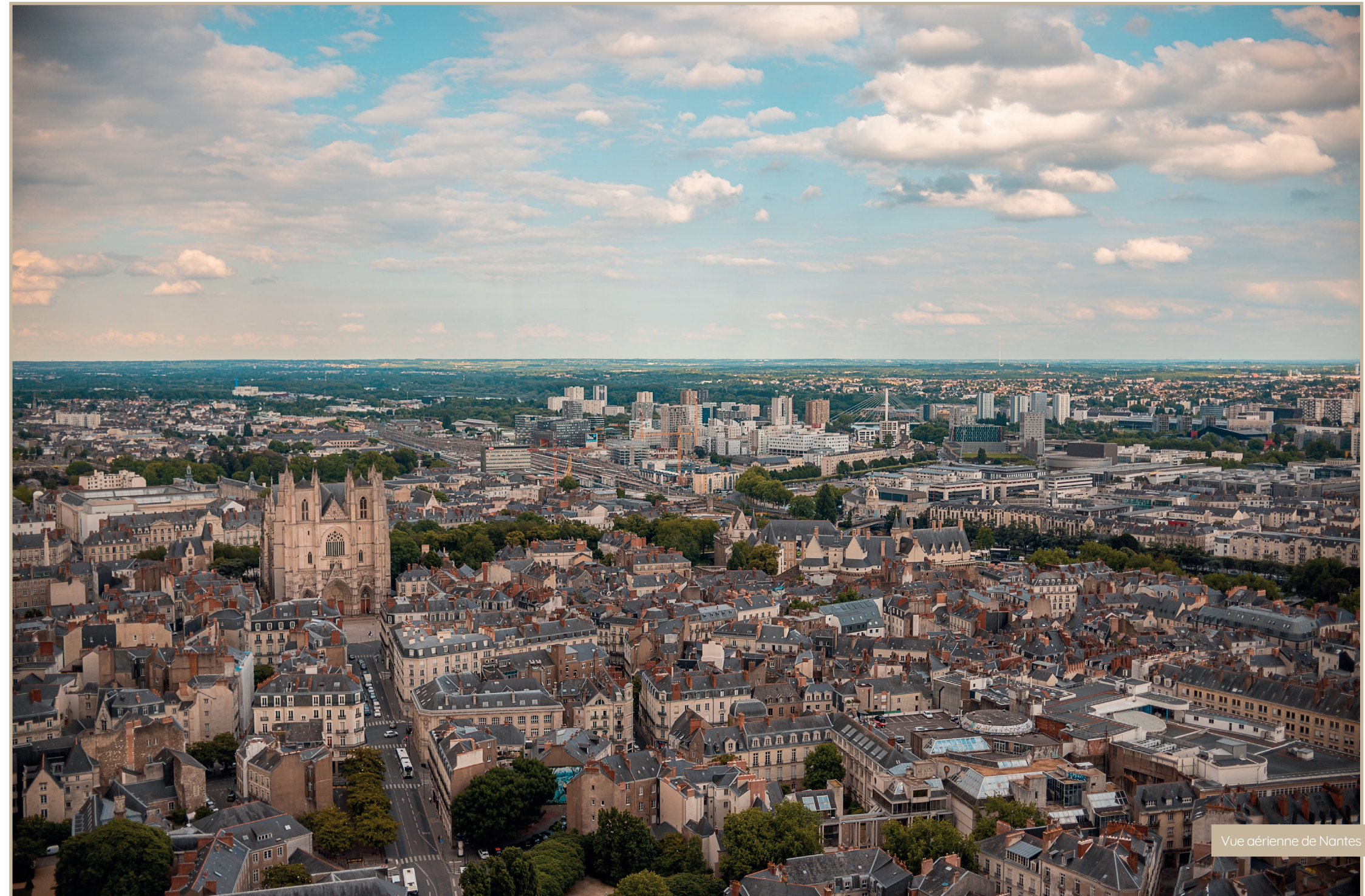
Vue aérienne de Nantes

Nantes a su, au cours des décennies, se développer en adéquation avec les problématiques urbaines, aménageant ainsi des zones piétonnes, de nombreuses pistes cyclables, des espaces de détente et proposant à ses habitants un réseau de transports en commun performant.