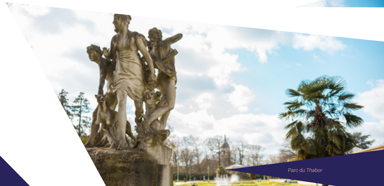
Parc du Thabor

Les Champs Libres regroupent le Musée de Bretagne, l'Espace des Sciences et son planétarium ainsi que la Bibliothèque de Rennes. Expositions et installations, arts visuels, arts numériques, performances littéraires et artistiques se côtoient dans ce lieu culturel bouillonnant.