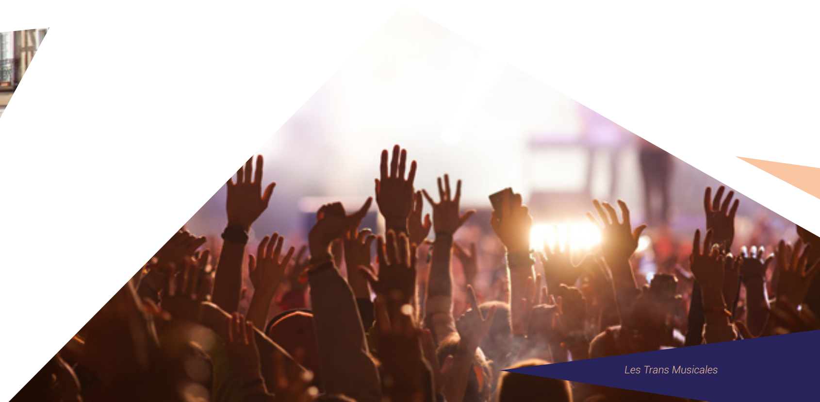
Les Trans Musicales

Les dimanches sont tout aussi animés à Rennes, avec des spectacles, des animations, des manifestations culturelles et sportives. Des événements partout dans la ville, pour faire de chaque dimanche un jour unique.