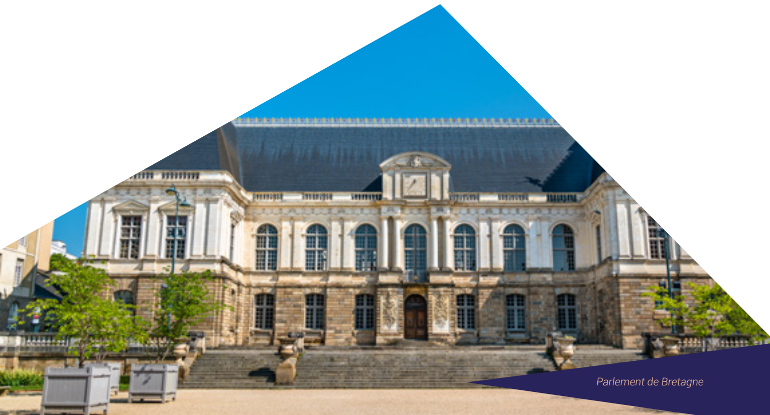
Parlement de Bretagne

Le Palais du Parlement de Bretagne est un des symboles de la Bretagne, conçu au XVII e siècle par l'architecte du Palais du Luxembourg, Salomon de Brosse. Il abrite la Cour d'Appel de la Bretagne et la Cour d'assises d'Ille-et-Vilaine. Magnifiquement restauré suite à l'incendie de 1994, sa visite permet d'admirer les peintures et dorures, notamment celles de la Grand'Chambre dont le plafond sculpté est unique en Europe.