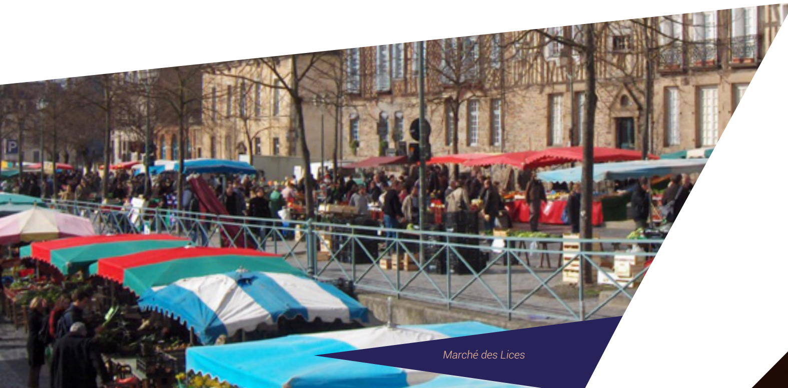
Marché des Lices

Crêpes ou galettes ? Blé ou sarrasin ? Salé ou sucré ? Faites votre choix dans les nombreuses et délicieuses crêperies bretonnes de la ville. Laissez-vous tenter par les bistrotts à vin conviviaux et les tables gastronomiques audacieuses. À Rennes, la tradition culinaire s'associe à la créativité pour le plaisir de vos papilles.