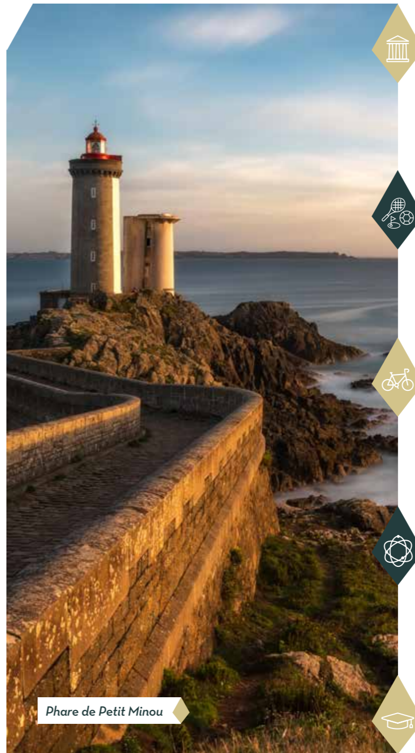
Phare de Petit Minou