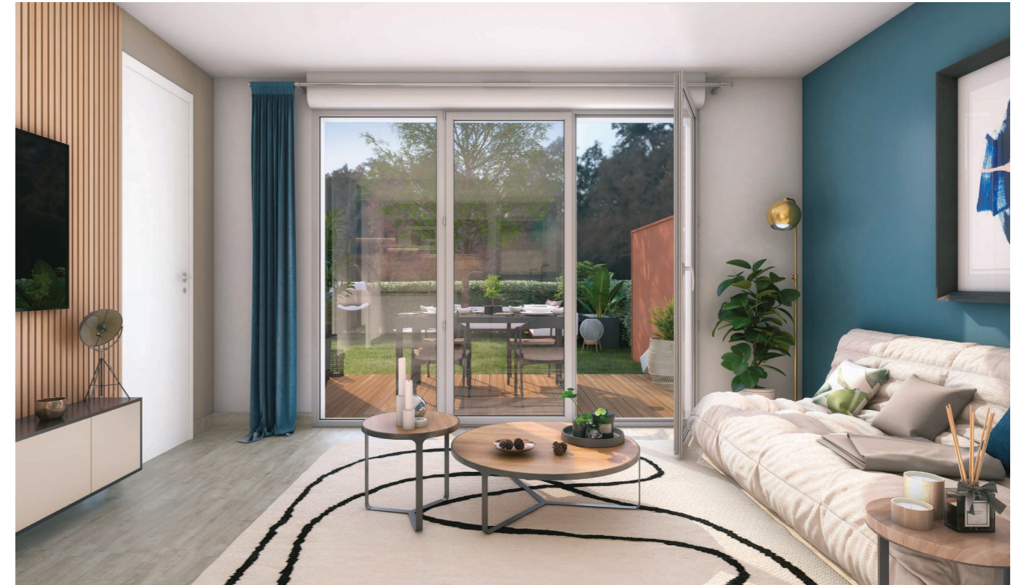
Exemple d'aménagement de votre salon - image non contractuelle

Choisissez votre logement en fonction de vos besoins et de votre projet.