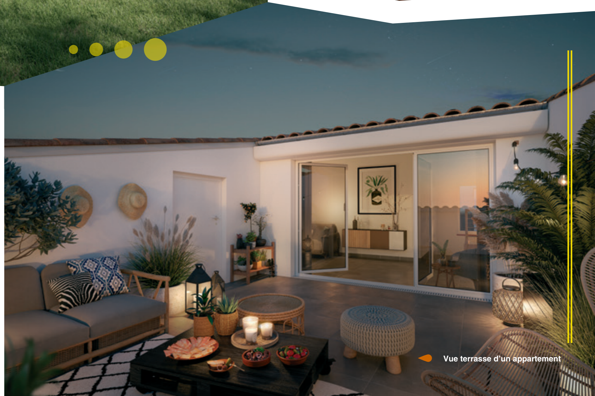
Vue terrasse d'un appartement