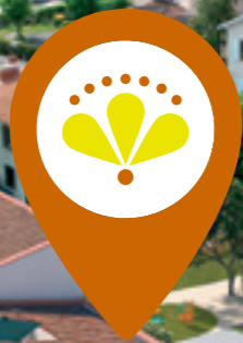
Vue drone de la résidence