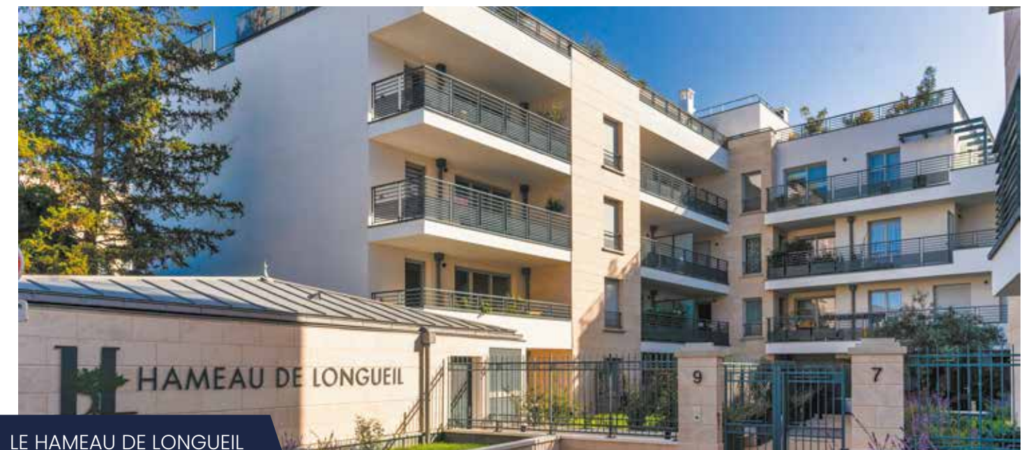
LE HAMEAU DE LONGUEIL MAISONS-LAFFITTE (78)