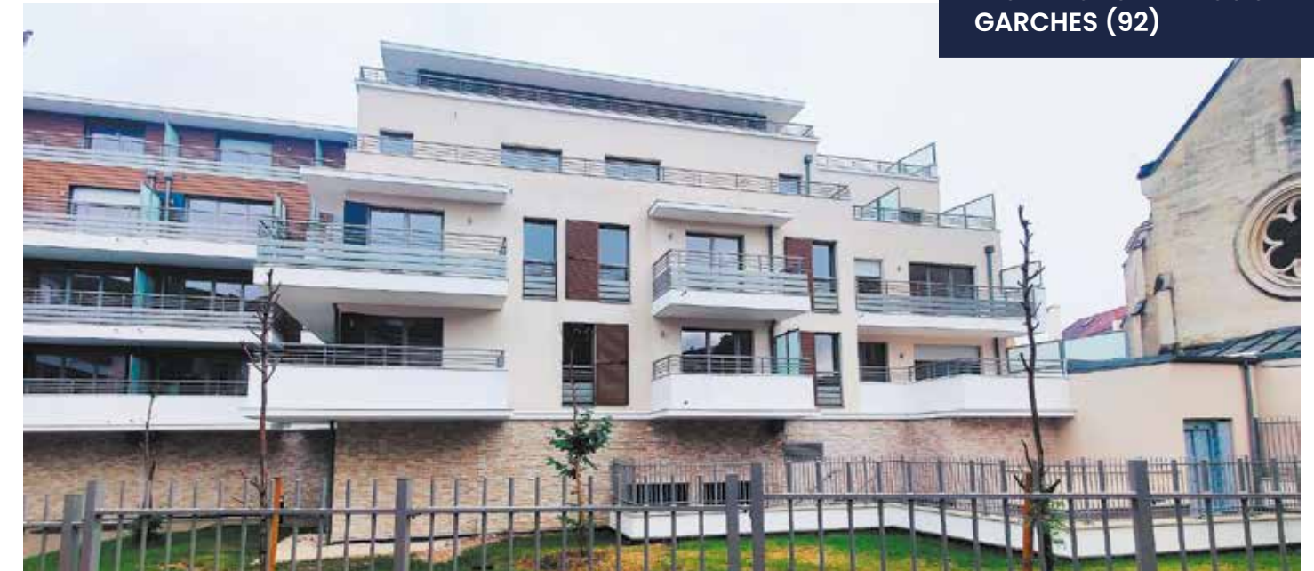
RÉSIDENCE SAINT-LOUIS GARCHES (92)