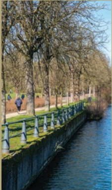
Berges de la Deûle