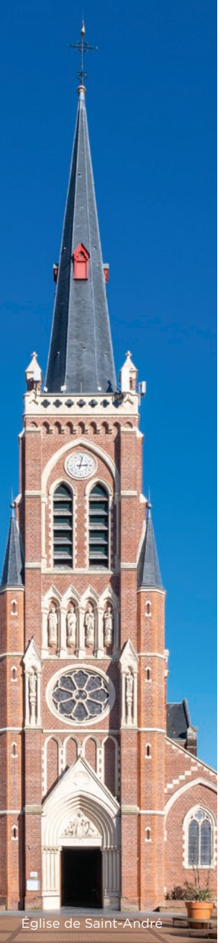
Église de Saint-André