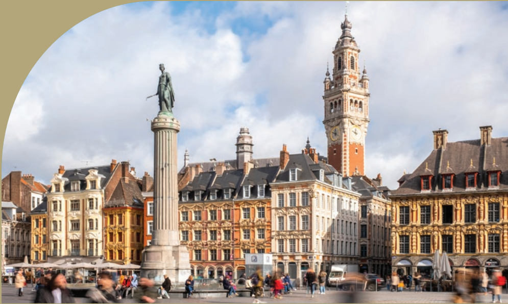
Grand Place de Lille