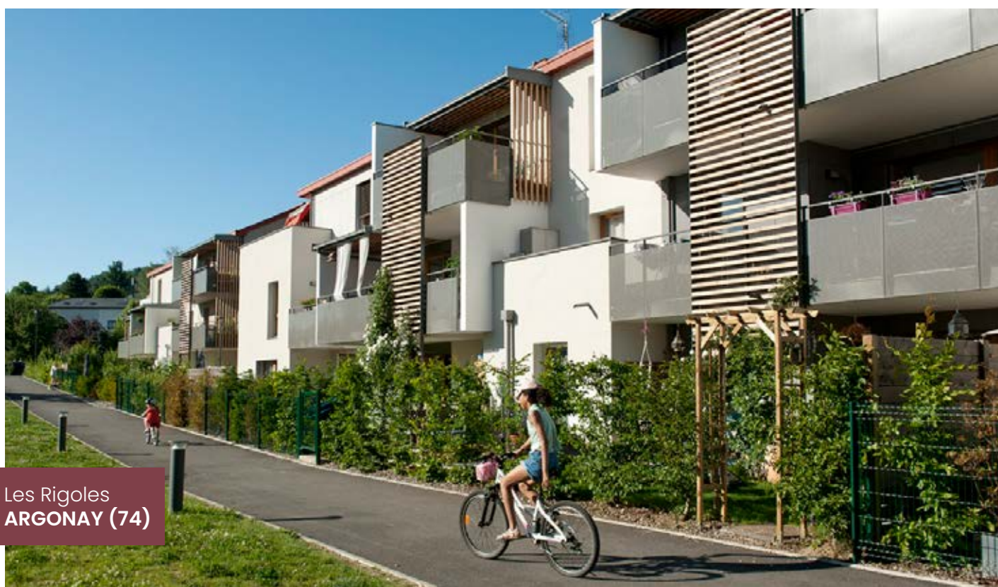
Les Rigoles ARGONAY (74)

NOS EXEMPLES DE RÉALISATIONS DANS L'AIN ET EN HAUTE-SAVOIE