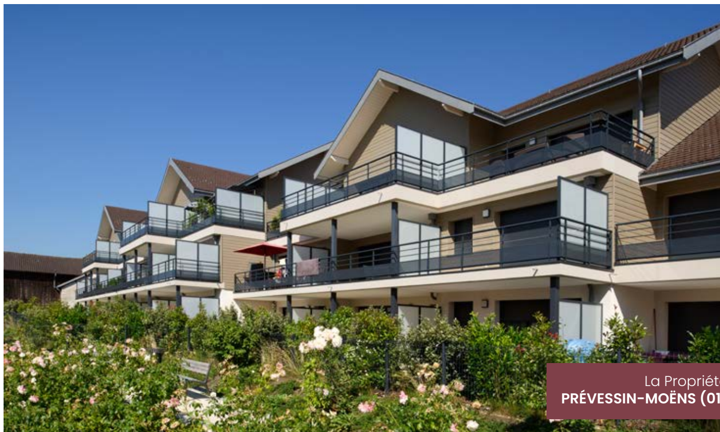
La Propriété PRÉVESSIN-MOËNS (01)

NOS EXEMPLES DE RÉALISATIONS DANS L'AIN ET EN HAUTE-SAVOIE