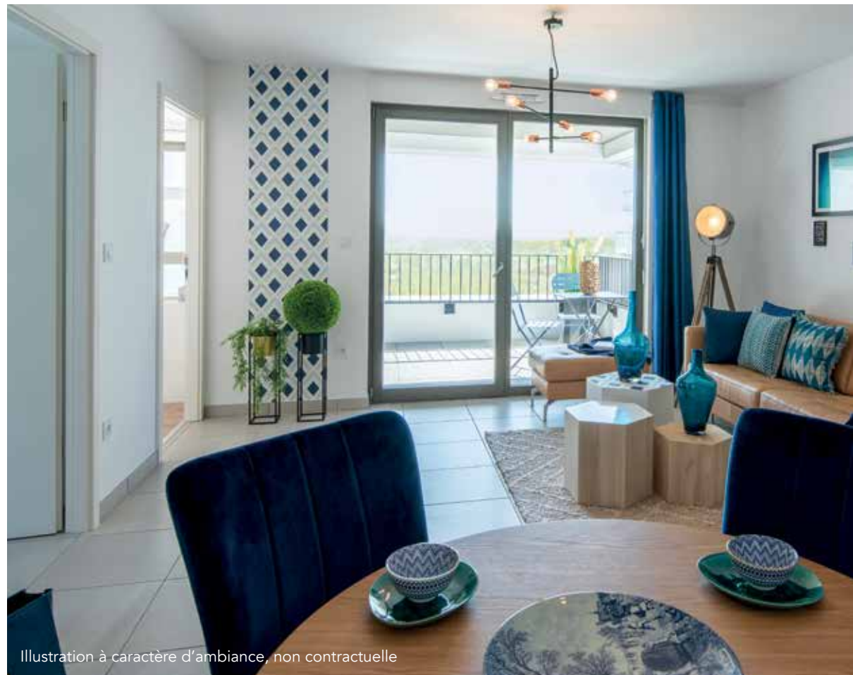
Illustration à caractère d'ambiance, non contractuelle