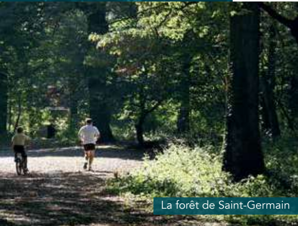
La forêt de Saint-Germain