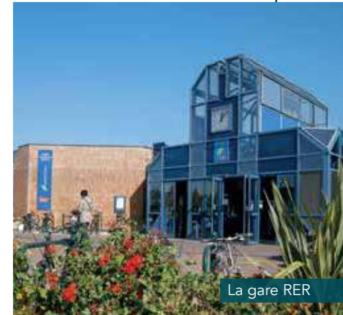
La gare RER