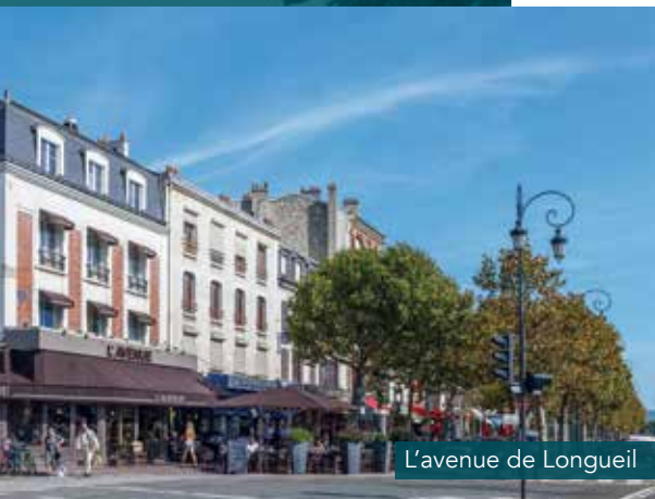
L'avenue de Longueil