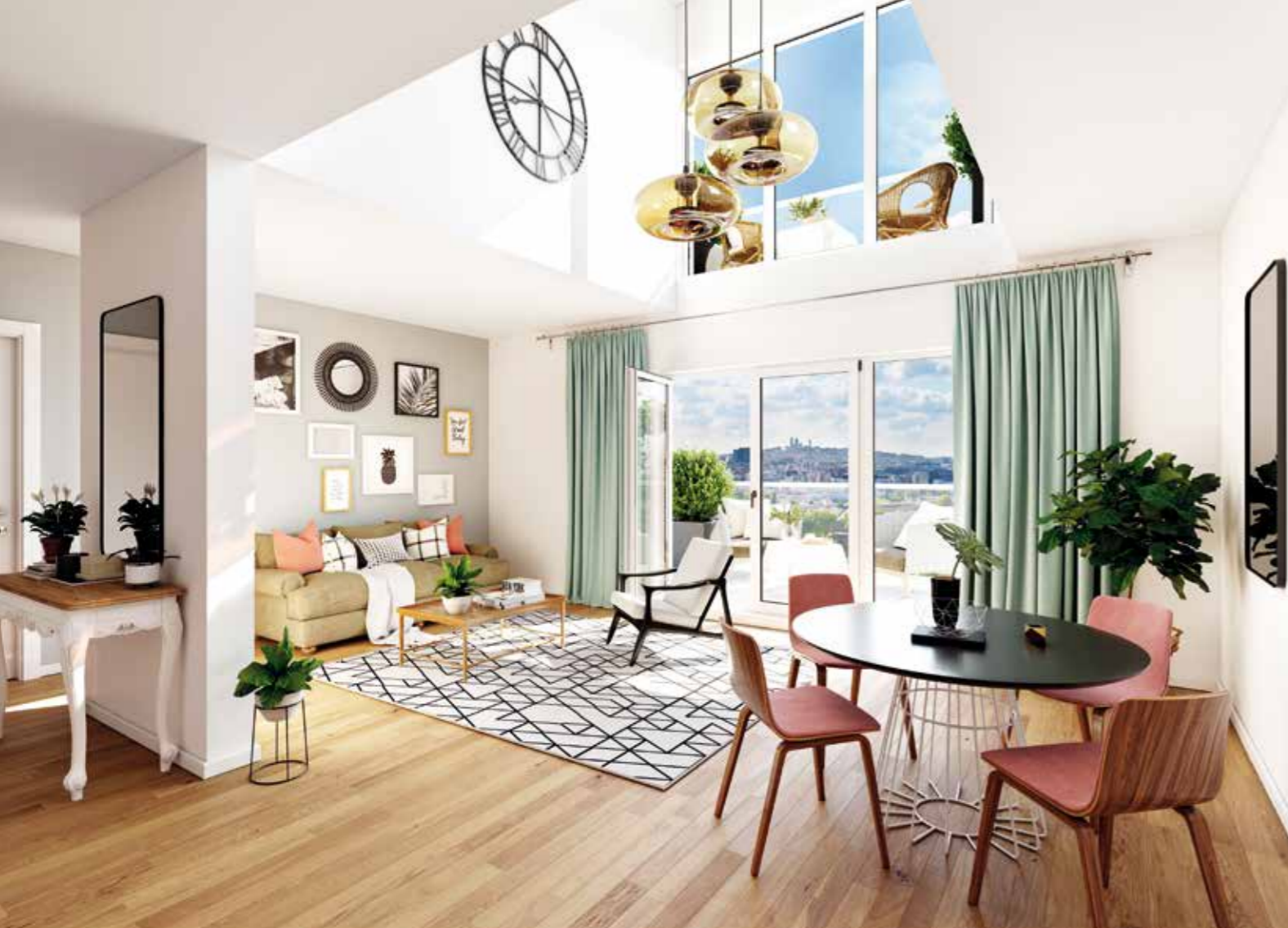
Vue intérieure de l'appartement 4 pièces duplex