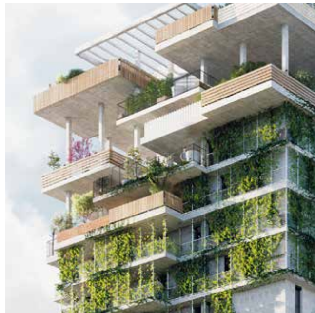
Des espaces extérieurs verdoyants