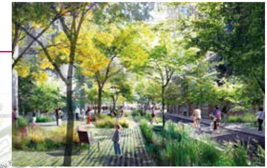
Mail promenade à l'ouest du quartier