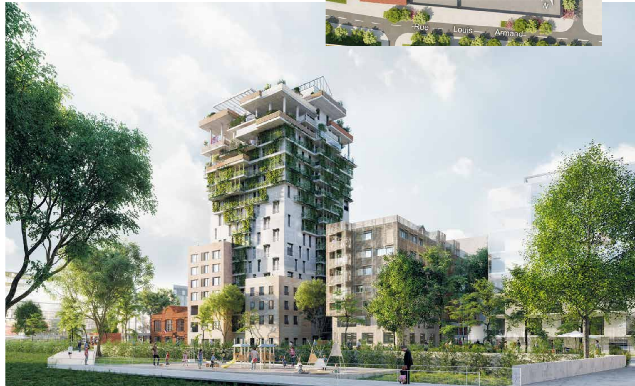
Vue de la résidence depuis le parc