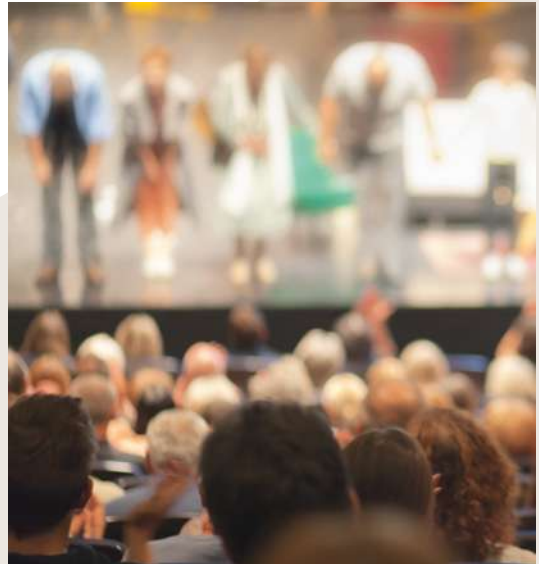
THÉÂTRE DE LA GOBINIÈRE