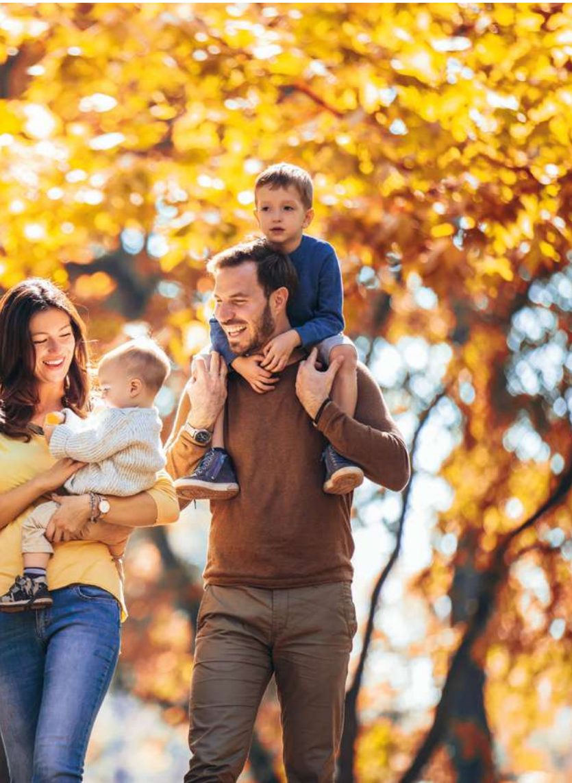
BALLADES AU PARC DE LA GAUDINIÈRE, PARC MICHEL BAUDRY OU VAL DE CHÉZINE