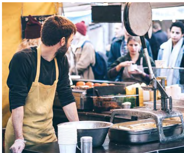
MARCHÉ DU PETIT CHANTILLY