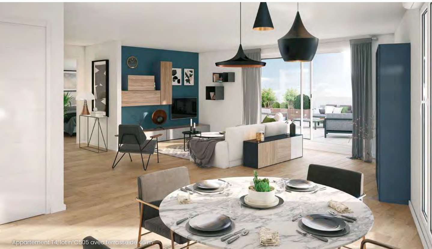
Appartement T4, lot n°C505 avec terrasse de 46 m 2