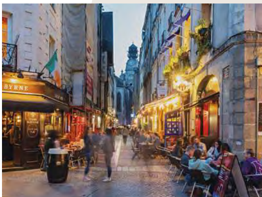
BARS & RESTAURANTS DU CENTRE HISTORIQUE DE NANTES