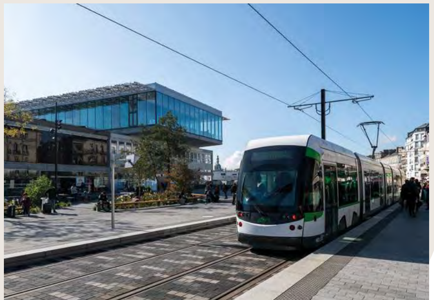
GARE TGV DE NANTES