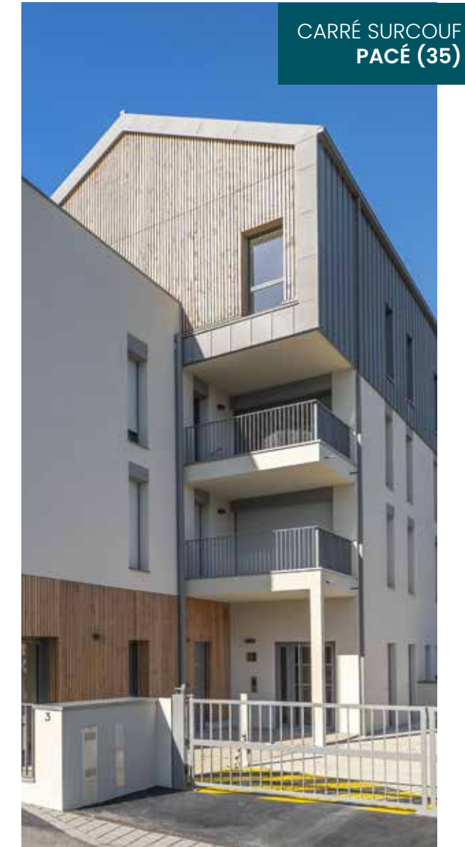
CARRÉ SURCOUF PACÉ (35)