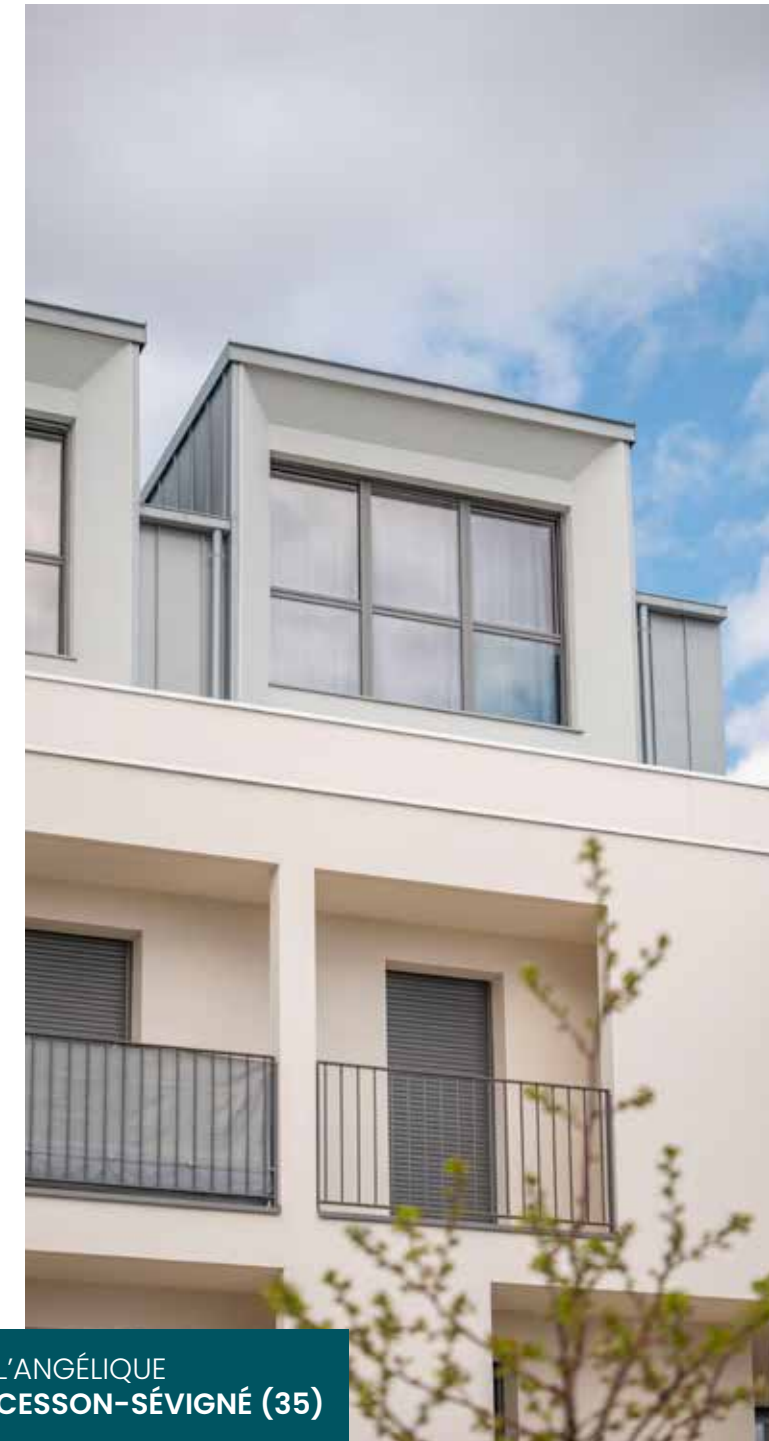
L'ANGÉLIQUE CESSON-SÉVIGNÉ (35)