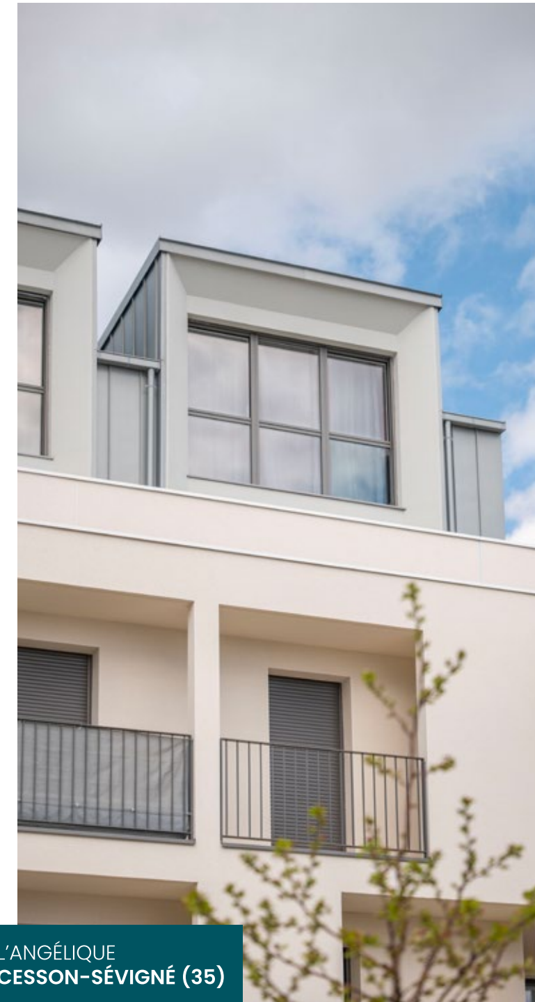
L'ANGÉLIQUE CESSON-SÉVIGNÉ (35)